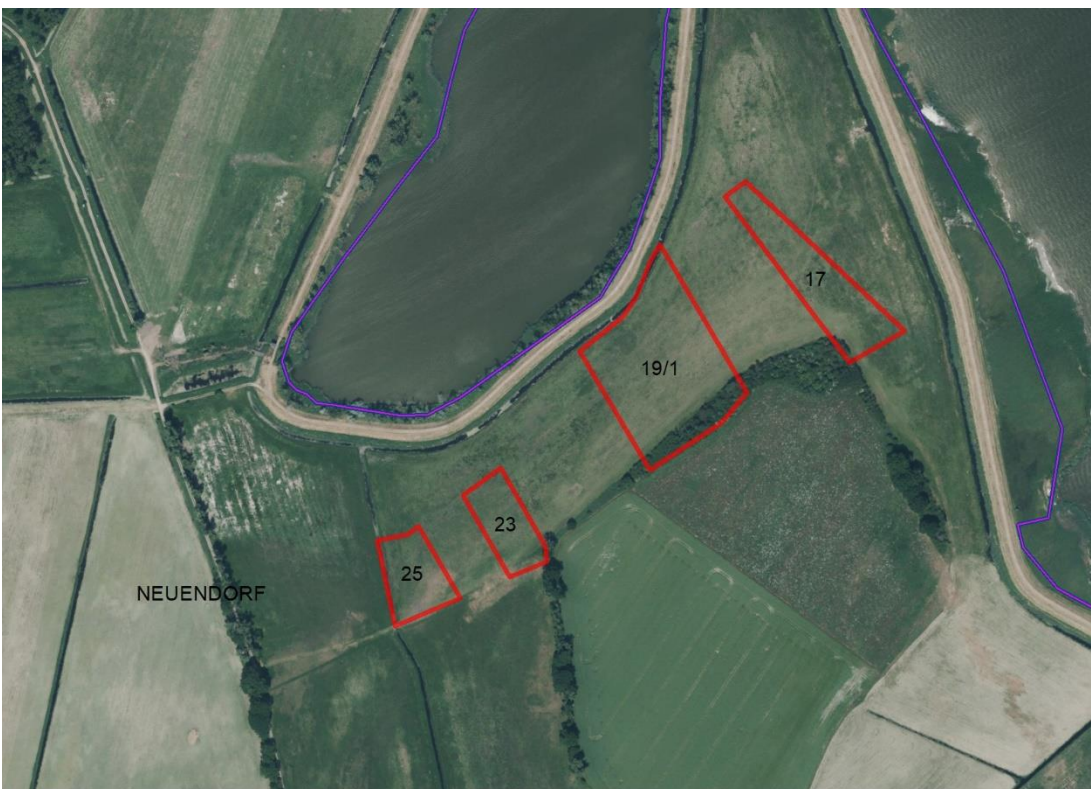
Luftbild BVVG GIS

Gemarkungsgrenzen Basis: © Ämter für Geoinformation und Vermessung der Länder Mecklenburg-Vorpommern, Niedersachsen, Brandenburg, Berlin, Sachsen-Anhalt, Sachsen, Thüringen; Geobasisdaten: © GeoBasis-DE / BKG (2026). Nutzungsbedingungen: http://sg.geodatenzentrum.de/web_public/nutzungsbedingungen.pdf . © GeoBasis-DE / BKG 2018 (Daten verändert). www.bkg.bund.de . Lageskizze