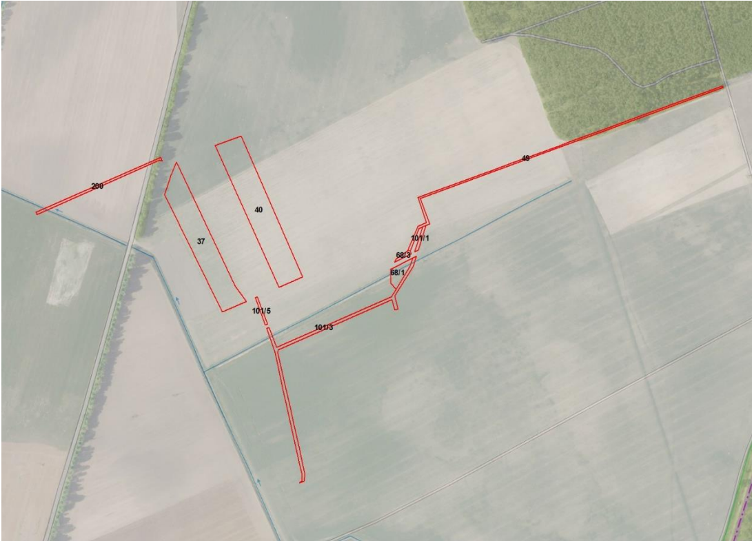
© Bundesamt für Kartographie und Geodäsie (2026). Datenquellen: http://sg.geodatenzentrum.de/web_public/Datenquellen_TopPlus_Open.pdf ; Geobasisdaten: © GeoBasis-DE / BKG (2026). Nutzungsbedingungen: http://sg.geodatenzentrum.de/web_public/nutzungsbedingungen.pdf ; © GeoBasis-DE / BKG 2018 (Daten verändert), www.bkg.bund.de ; Lagekizze