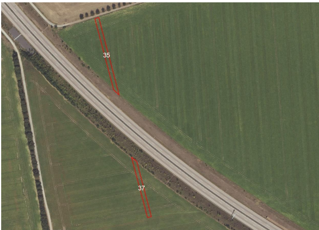
Detailansicht Schraplau Flur 5

Geobasisdaten: © GeoBasis-DE / BKG (2025). Nutzungsbedingungen: http://sg.geodatenzentrum.de/web_public/nutzungsbedingungen.pdf . © GeoBasis-DE / BKG 2018 (Daten verändert). www.bkg.bund.de . Lageskizze