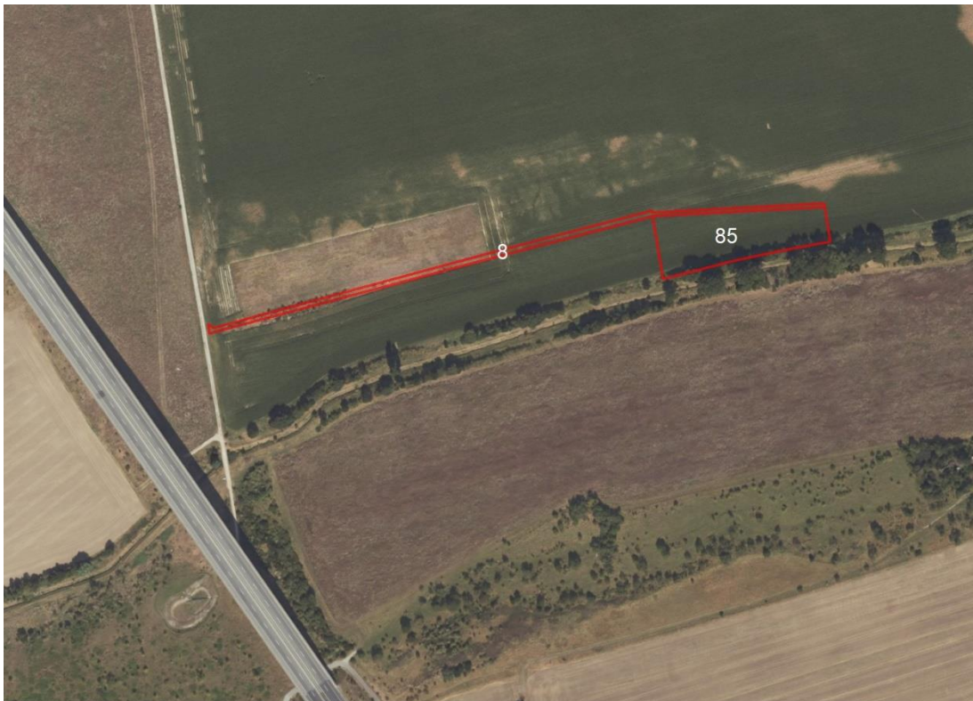
Übersichtskarte Alberstedt und Schraplau

Lageskizze