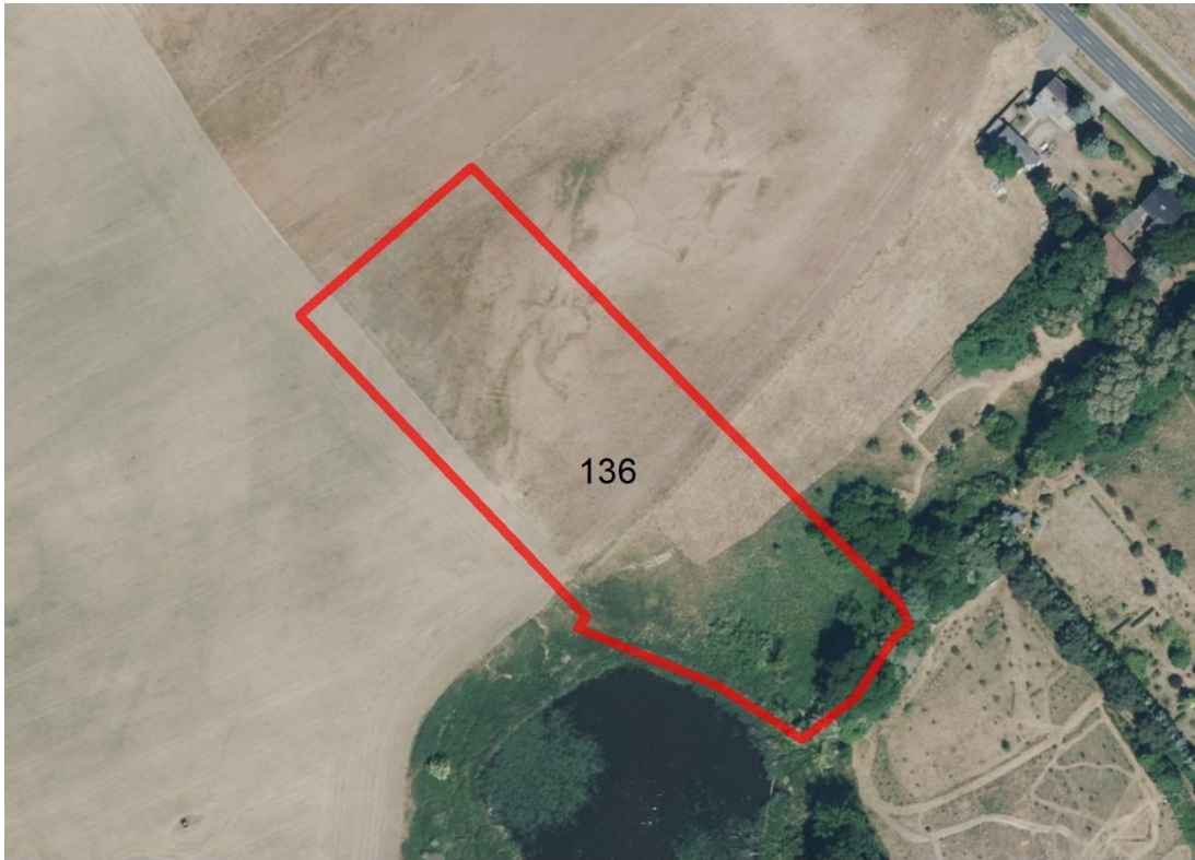
Geobasisdaten: © GeoBasis-DE / BKG (2026). Nutzungsbedingungen: http://sg.geodatenzentrum.de/web_public/nutzungsbedingungen.pdf . Lageskizze