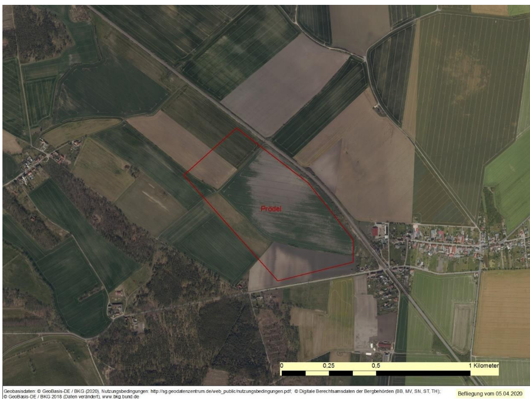
Luftbild, Projektion des BWE (2)