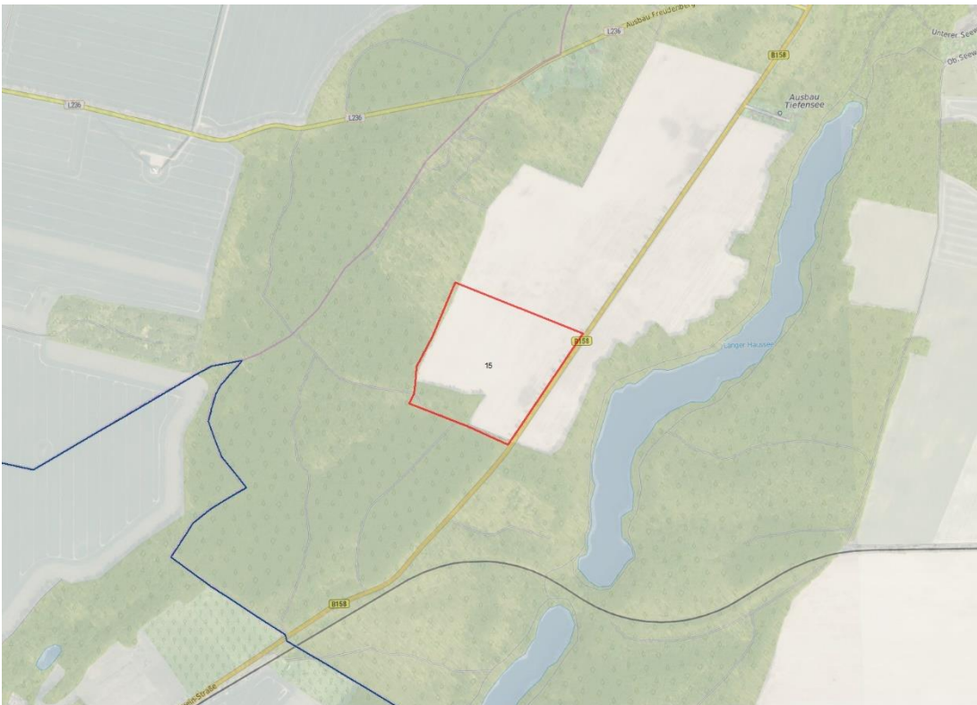
© Bundesamt für Kartographie und Geodäsie (2026). Datenquellen: http://sg.geodatenzentrum.de/web_public/Datenquellen_TopPlus_Open.pdf . Geobasisdaten: © GeoBasis-DE / BKG (2026). Nutzungsbedingungen: http://sg.geodatenzentrum.de/web_public/nutzungsbedingungen.pdf . © GeoBasis-DE / BKG 2018 (Daten verändert), www.bkg.bund.de ; Lageskizze