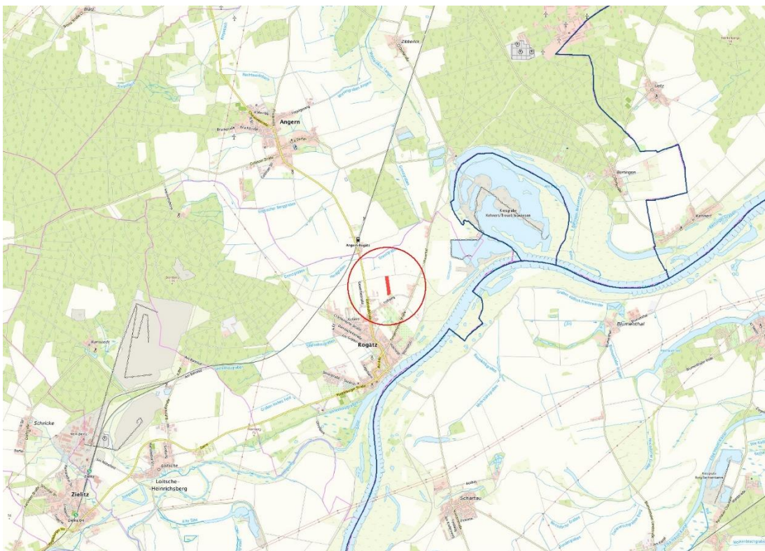
Objektübersicht - top. Karte

© Bundesamt für Kartographie und Geodäsie (2026). Datenquellen: http://sg.geodatenzentrum.de/web_public/Datenquellen_TopPlus_Open.pdf . © GeoBasis-DE / BKG 2018 (Daten verändert), www.bkg.bund.de ; Lageskizze