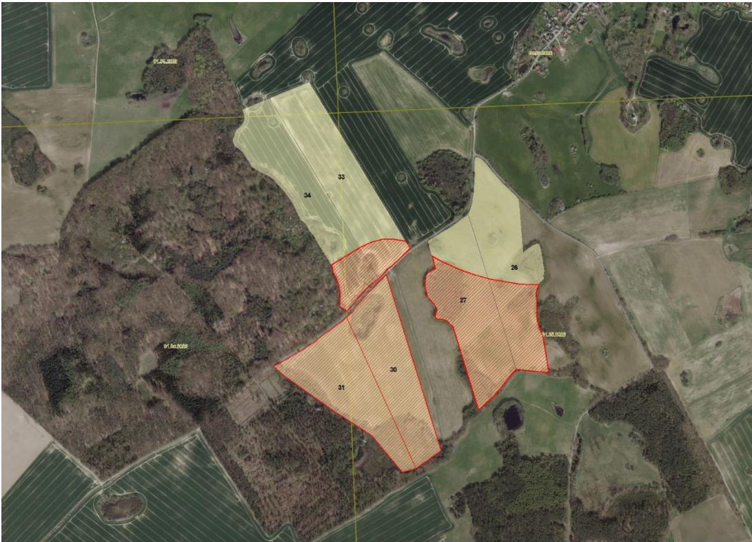
Geobasisdaten: © GeoBasis-DE / BKG (2025), Nutzungsbedingungen: http://sg.geodatenzentrum.de/web_public/nutzungsbedingungen.pdf . © GeoBasis-DE / BKG 2018 (Daten verändert), www.bkg.bund.de , Lageskizze