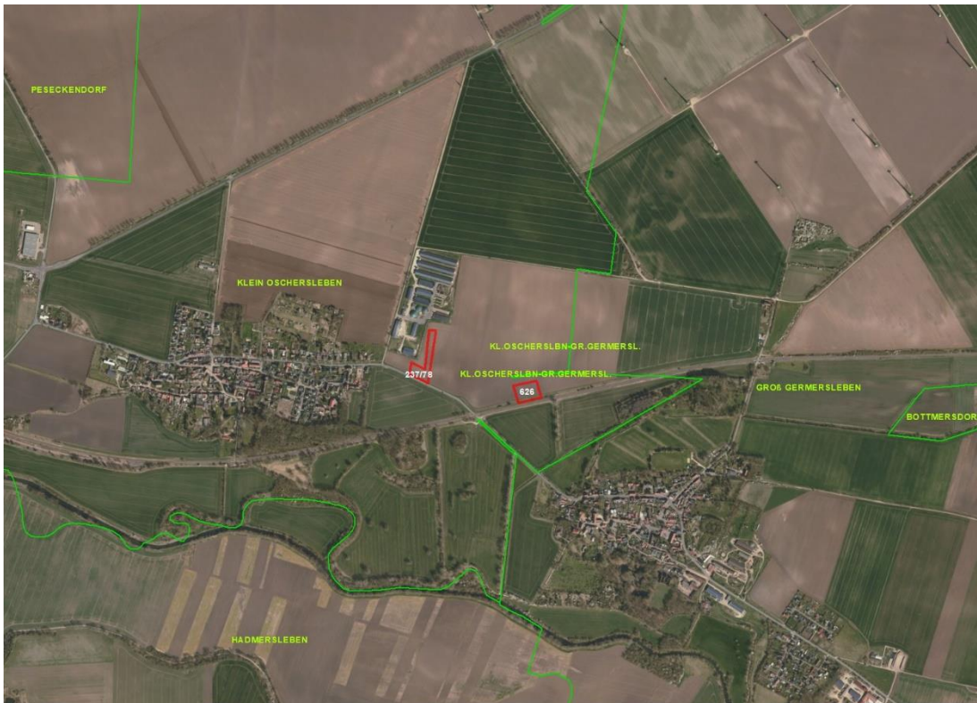
Objektübersicht - Luftbild

Gemarkungsgrenzen Basis: © Ämter für Geoinformation und Vermessung der Länder Mecklenburg-Vorpommern, Niedersachsen, Brandenburg, Berlin, Sachsen-Anhalt, Sachsen, Thüringen, Basis: © Ämter für Geoinformation und Vermessung der Länder Mecklenburg-Vorpommern, Niedersachsen, Brandenburg, Berlin, Sachsen-Anhalt, Sachsen, Thüringen, Geobasisdaten: © GeoBasis-DE / BKG (2026), Nutzungsbedingungen: http://sg.geodatenzentrum.de/web_public/nutzungsbedingungen.pdf , Lageskizze