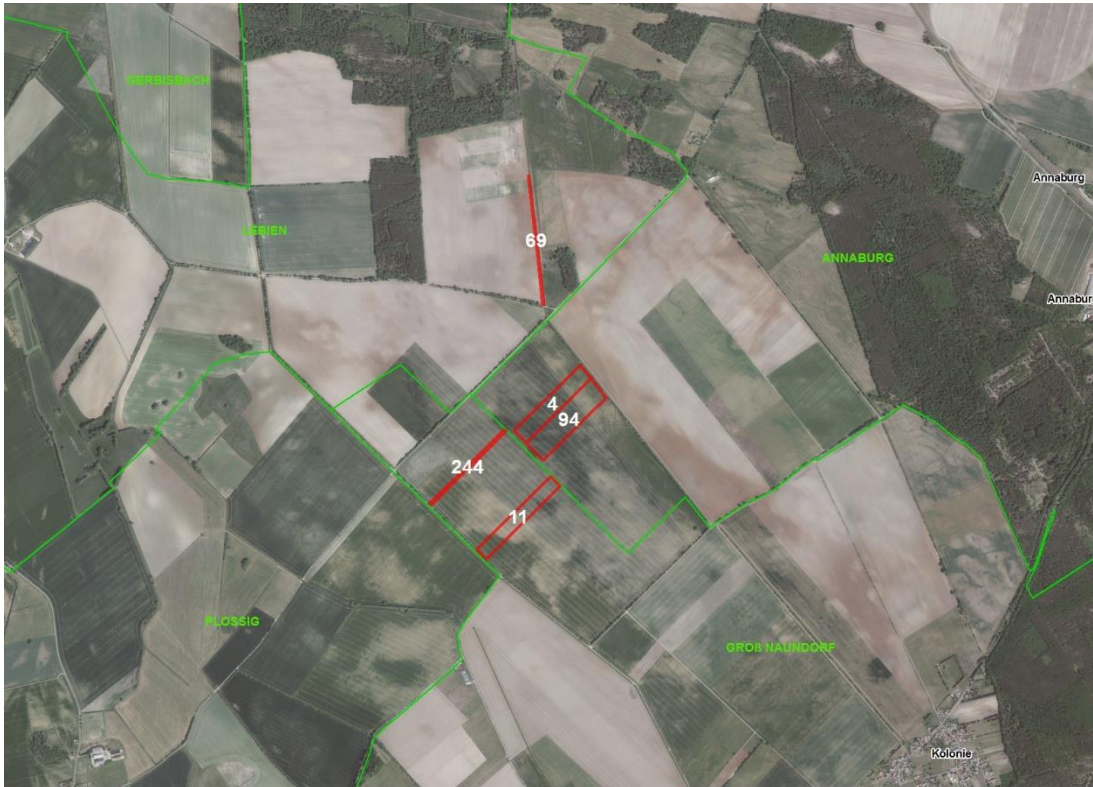
Gemarkungsgrenzen Basis: © Amt für Geoinformation und Vermessung der Länder Mecklenburg-Vorpommern, Niedersachsen, Brandenburg, Berlin, Sachsen-Anhalt, Sachsen, Thüringen, Geobasisdaten © GeoBasis-DE / BKG (2024), Nutzungsbedingungen: http://sg.geodatenzentrum.de/web_public/nutzungsbedingungen.pdf , © GeoBasis-DE / BKG 2023 (Daten verändert), http://sg.geodatenzentrum.de/web_public/nutzungsbedingungen.pdf , © GeoBasis-DE / BKG 2018 (Daten verändert), www.bkg.bund.de , Lageskizze