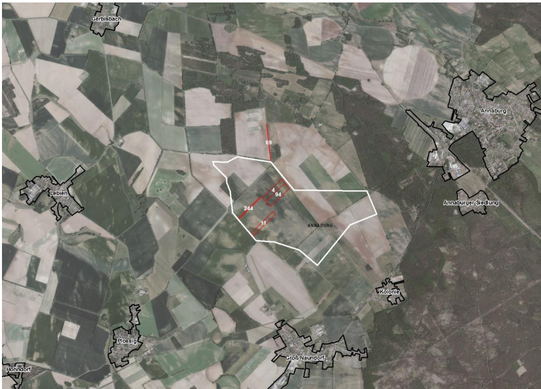
Geobasisdaten © GeoBasis-DE / BKG (2024), Nutzungsbedingungen: http://sg.geodatenzentrum.de/web_public/nutzungsbedingungen.pdf , © GeoBasis-DE / BKG 2023 (Daten verändert), http://sg.geodatenzentrum.de/web_public/nutzungsbedingungen.pdf , © GeoBasis-DE / BKG 2018 (Daten verändert), www.bkg.bund.de , Lageskizze