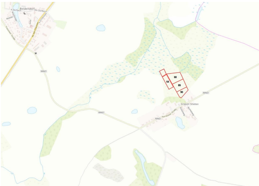
© Bundesamt für Kartographie und Geodäsie (2026). Datenquellen: http://sg.geodatenzentrum.de/web_public/Datenquellen_TopPlus_Open.pdf . © GeoBasis-DE / BKG 2018 (Daten verändert), www.bkg.bund.de; Lageskizze