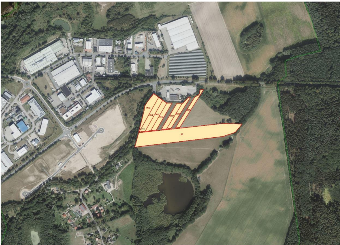
Luftbild der Angebotsflächen

Lageskizze