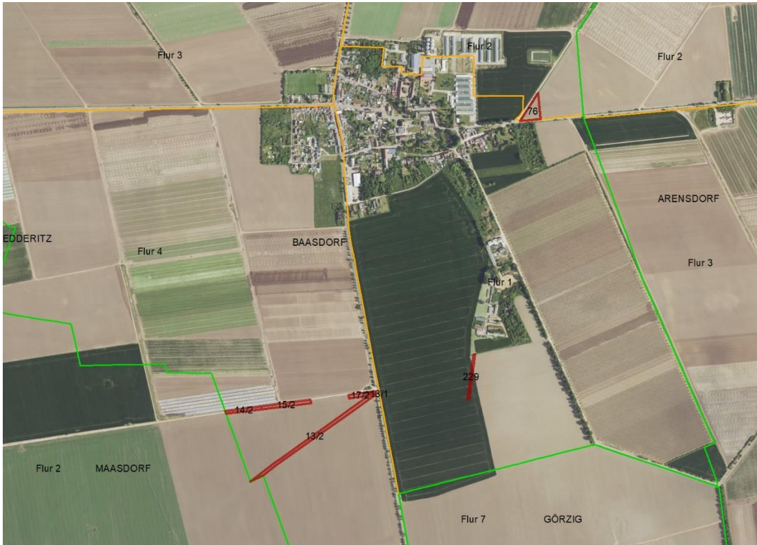
Gemarkungsgrenzen Lageskizze