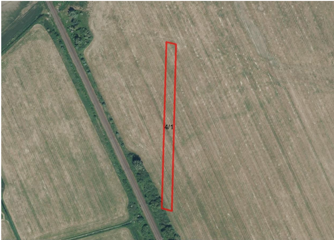
Geobasisdaten: © GeoBasis-DE / BKG (2026). Nutzungsbedingungen: http://sg.geodatenzentrum.de/web_public/nutzungsbedingungen.pdf . Lageskizze