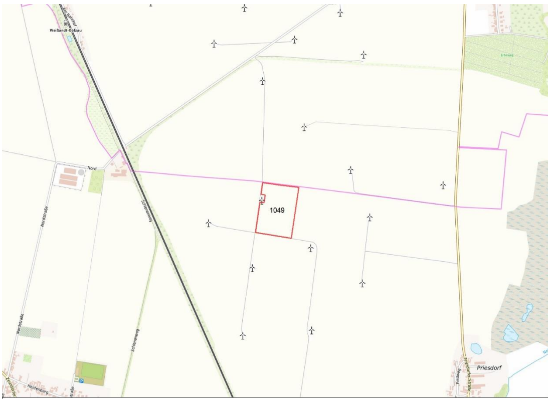
topogr. Karte 2