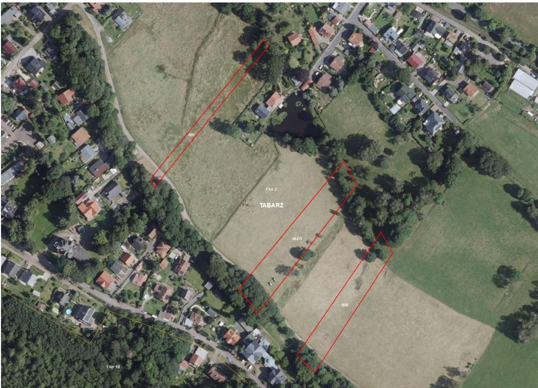
Gemarkung Tabarz, Flur 2, 4, 9

Gemarkungsgrenzen Basis: © Ämter für Geoinformation und Vermessung der Länder Mecklenburg-Vorpommern, Niedersachsen, Brandenburg, Berlin, Sachsen-Anhalt, Sachsen, Thüringen, Geobasisdaten © GeoBasis-DE / BKG (2026), Nutzungsbedingungen: http://sg.geodatenzentrum.de/web_public/nutzungsbedingungen.pdf , © GeoBasis-DE / BKG 2018 (Daten verändert), www.bkg.bund.de , Lageskizze