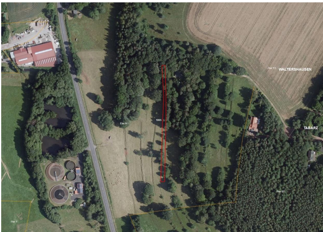
Gemarkung Tabarz, Flur 4, FS 615/6, 691/2

Gemarkungsgrenzen Basis: © Ämter für Geoinformation und Vermessung der Länder Mecklenburg-Vorpommern, Niedersachsen, Brandenburg, Berlin, Sachsen-Anhalt, Sachsen, Thüringen; Geobasisdaten © GeoBasis-DE / BKG (2026). Nutzungsbedingungen: http://sg.geodatenzentrum.de/web_public/nutzungsbedingungen.pdf ; © GeoBasis-DE / BKG 2018 (Daten verändert); www.bkg.bund.de ; Lageskizze