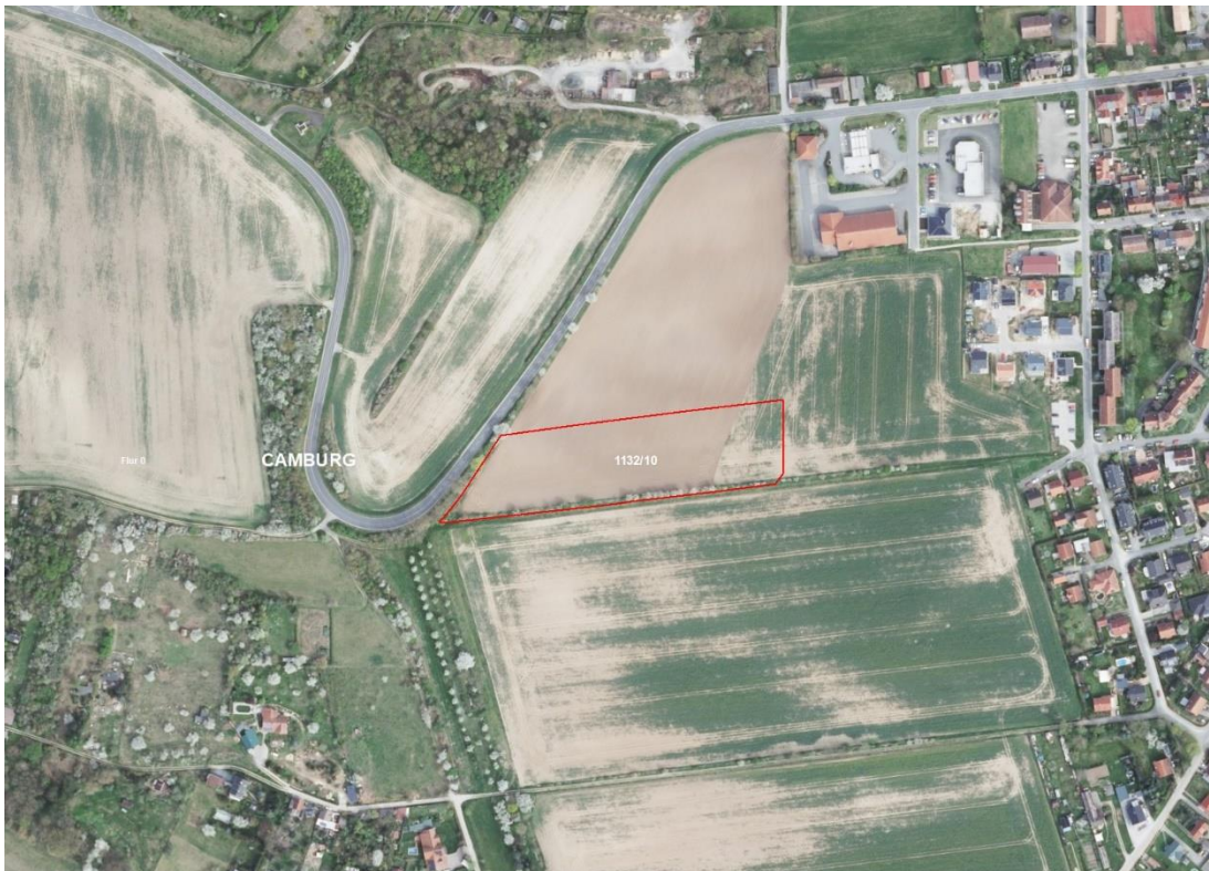
Gemarkung Camburg, Wonnitz, Flur 0, FS 1132/10 und 123

Gemarkungsgrenzen Basis. © Amt für Geoinformation und Vermessung der Länder Mecklenburg-Vorpommern, Niedersachsen, Brandenburg, Berlin, Sachsen-Anhalt, Sachsen, Thüringen, Basis: © Amt für Geoinformation und Vermessung der Länder Mecklenburg-Vorpommern, Niedersachsen, Brandenburg, Berlin, Sachsen-Anhalt, Sachsen, Thüringen, Geobasisdaten © GeoBasis-DE / BKG (2026), Nutzungsbedingungen: http://sg.geodatenzentrum.de/web_public/nutzungsbedingungen.pdf Lageskizze