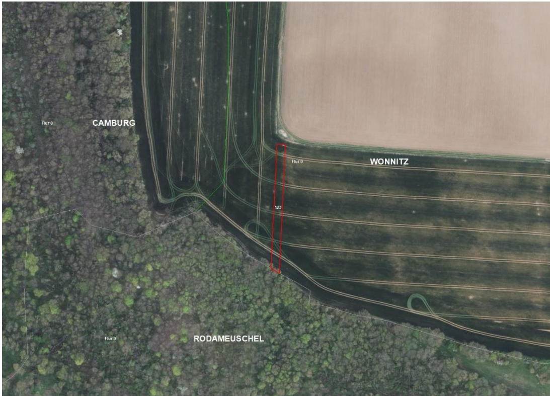
Gemarkungsgrenzen Basis: © Ämter für Geoinformation und Vermessung der Länder Mecklenburg-Vorpommern, Niedersachsen, Brandenburg, Berlin, Sachsen-Anhalt, Sachsen, Thüringen, Basis: © Ämter für Geoinformation und Vermessung der Länder Mecklenburg-Vorpommern, Niedersachsen, Brandenburg, Berlin, Sachsen-Anhalt, Sachsen, Thüringen, Geobasisdaten: © GeoBasis-DE / BKG (2025), Nutzungsbedingungen: http://sg.geodatenzentrum.de/web_public/nutzungsbedingungen.pdf , Lageskizze