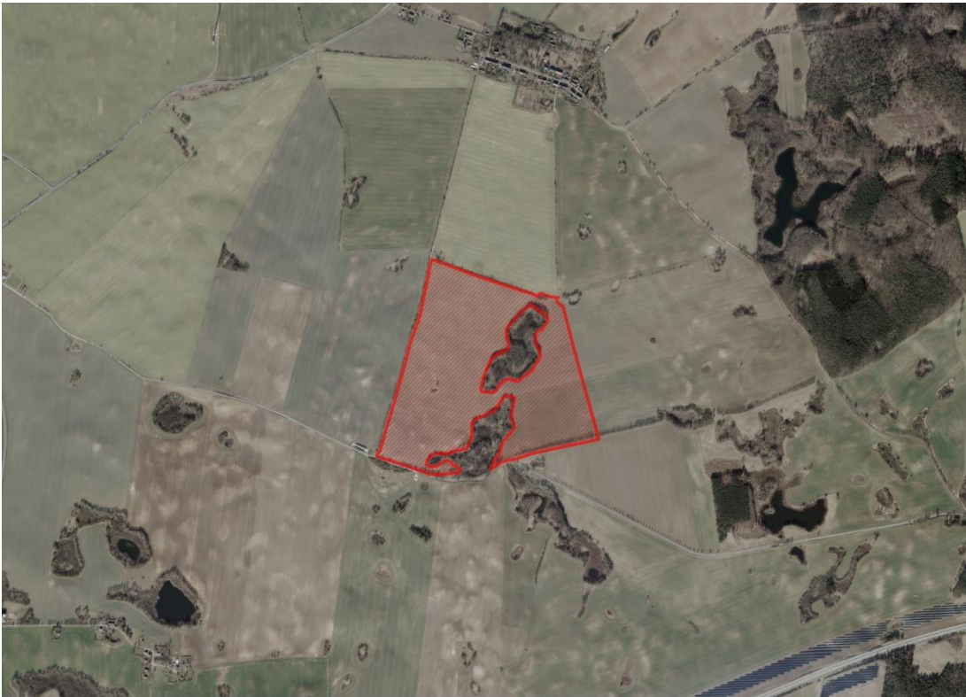
Geobasisdaten: © GeoBasis-DE / BKG (2024). Nutzungsbedingungen: http://sg.geodatenzentrum.de/web_public/nutzungsbedingungen.pdf . © GeoBasis-DE / BKG 2018 (Daten verändert). www.bkg.bund.de . Lageskizze