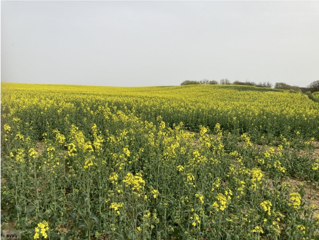
Blick auf das Ackerland