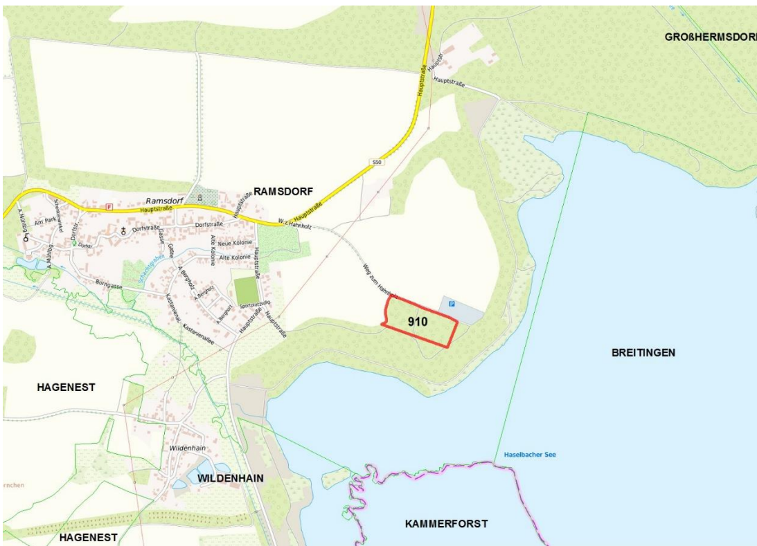
Topografische Karte 1

Gemarkungsgrenzen Basis: © Ämter für Geoinformation und Vermessung der Länder Mecklenburg-Vorpommern, Niedersachsen, Brandenburg, Berlin, Sachsen-Anhalt, Sachsen, Thüringen, © Bundesamt für Kartographie und Geodäsie (2024), Datenquellen: http://sg.geodatenzentrum.de/web_public/Datenquellen_TopPlus_Open.pdf , © GeoBasis-DE / BKG 2018 (Daten verändert), www.bkg.bund.de ; Lageskizze