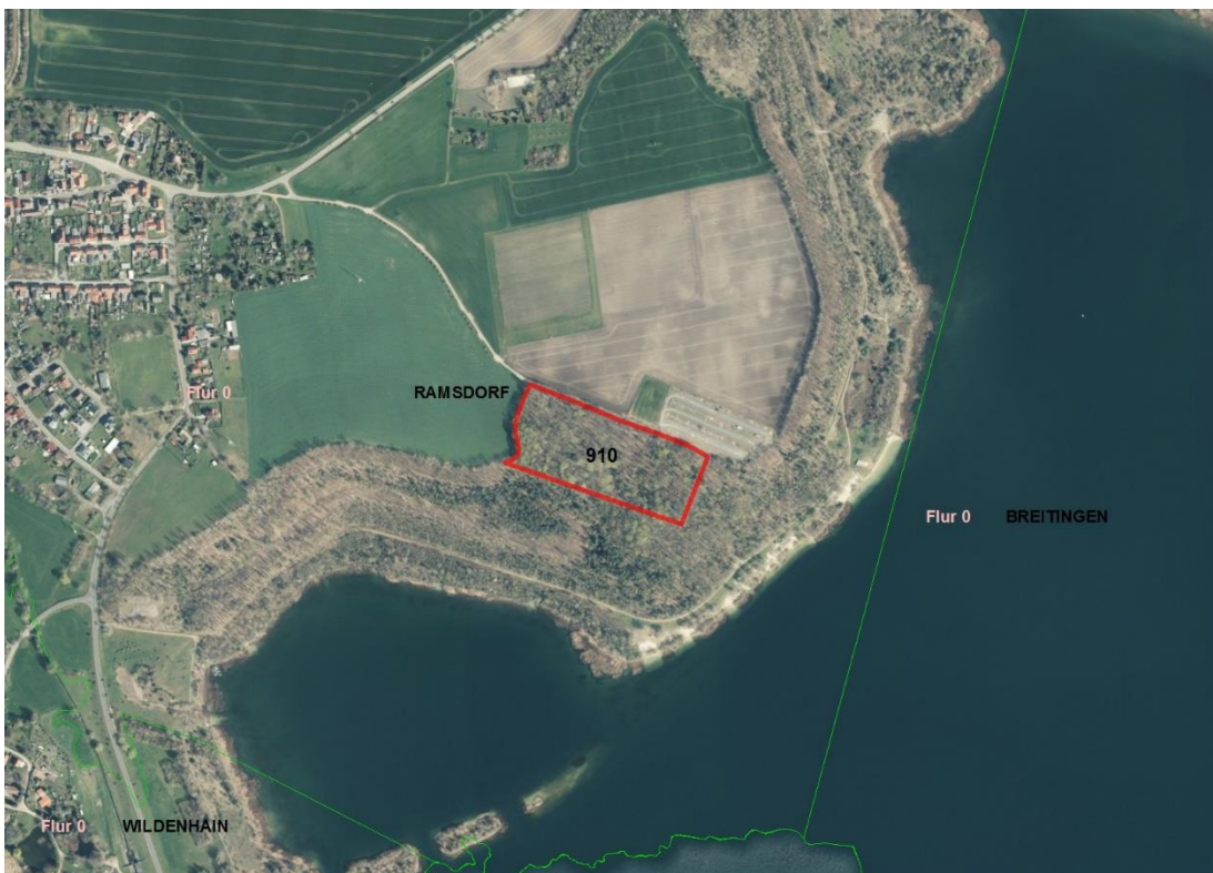
BVVG:GIS; Luftbild 1

Gemarkungsgrenzen Basis: © Ämter für Geoinformation und Vermessung der Länder Mecklenburg-Vorpommern, Niedersachsen, Brandenburg, Berlin, Sachsen-Anhalt, Sachsen, Thüringen; Geobasisdaten: © GeoBasis-DE / BKG (2024). Nutzungsbedingungen: http://sg.geodatenzentrum.de/web_public/nutzungsbedingungen.pdf ; © GeoBasis-DE / BKG 2018 (Daten verändert); www.bkg.bund.de , Lageskizze