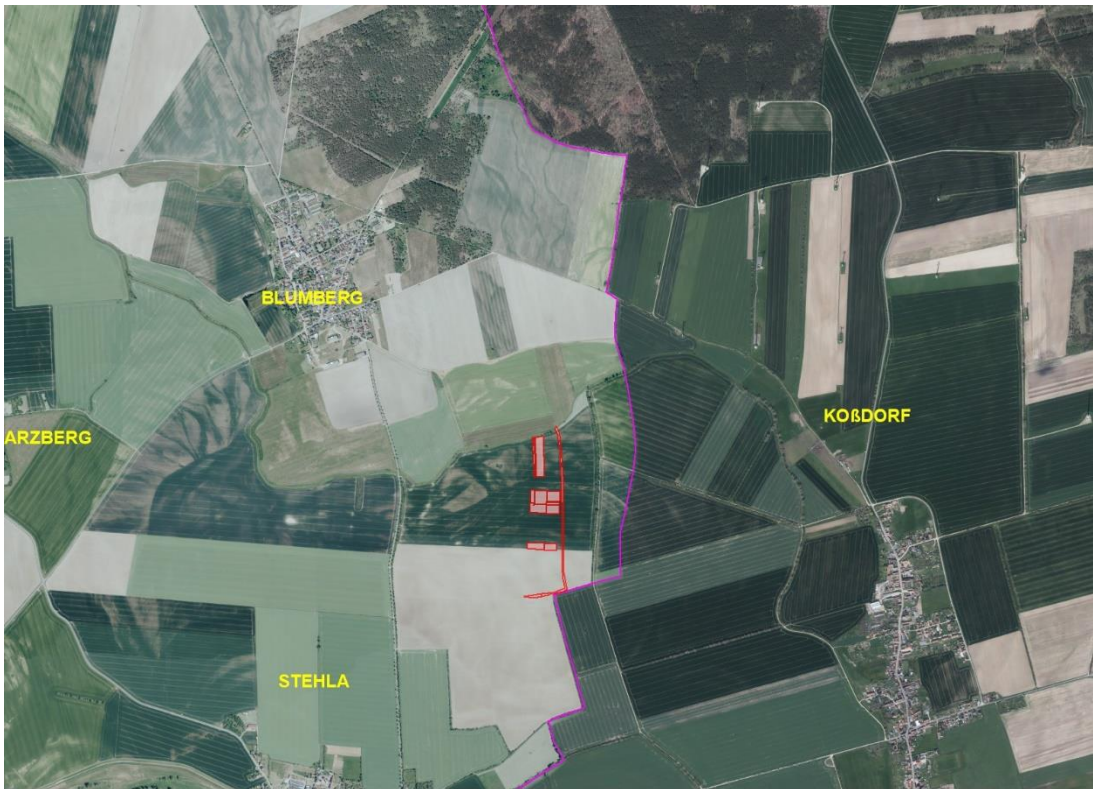
Gemarkungsgrenzen Basis: © Ämter für Geoinformation und Vermessung der Länder Mecklenburg-Vorpommern, Niedersachsen, Brandenburg, Berlin, Sachsen-Anhalt, Sachsen, Thüringen; Geobasisdaten © GeoBasis-DE / BKG (2025). Nutzungsbedingungen: http://sg.geodatenzentrum.de/web_public/nutzungsbedingungen.pdf , © GeoBasis-DE / BKG 2018 (Daten verändert), www.bkg.bund.de , Lagekarte