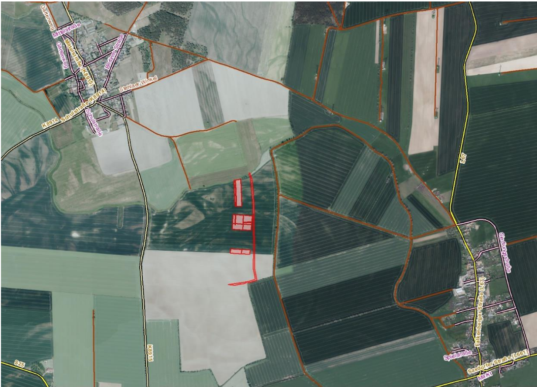
Geobasisdaten © GeoBasis-DE / BKG (2026). Nutzungsbedingungen: http://sg.geodatenzentrum.de/web_public/nutzungsbedingungen.pdf . © GeoBasis-DE / BKG 2024 (Daten verändert). http://sg.geodatenzentrum.de/web_public/nutzungsbedingungen.pdf . © GeoBasis-DE / BKG 2018 (Daten verändert). www.bkg.bund.de; Lageskizze