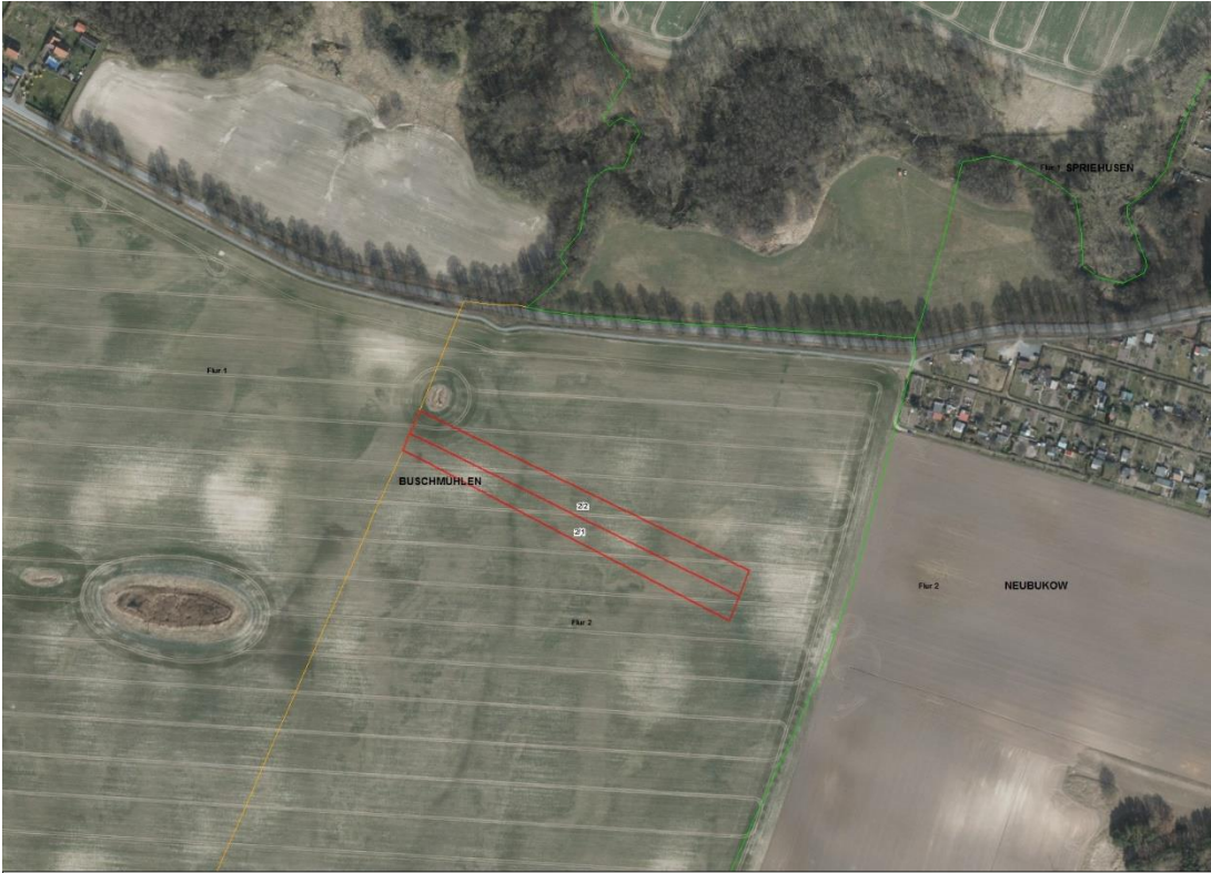
Gemarkungsgrenzen Basis: © Ämter für Geoinformation und Vermessung der Länder Mecklenburg-Vorpommern, Niedersachsen, Brandenburg, Berlin, Sachsen-Anhalt, Sachsen, Thüringen, Geobasisdaten © GeoBasis-DE / BKG (2024). Nutzungsbedingungen: http://sg.geodatenzentrum.de/web_public/nutzungsbedingungen.pdf , © GeoBasis-DE / BKG 2018 (Daten verändert), www.bkg.bund.de , Lageskizze