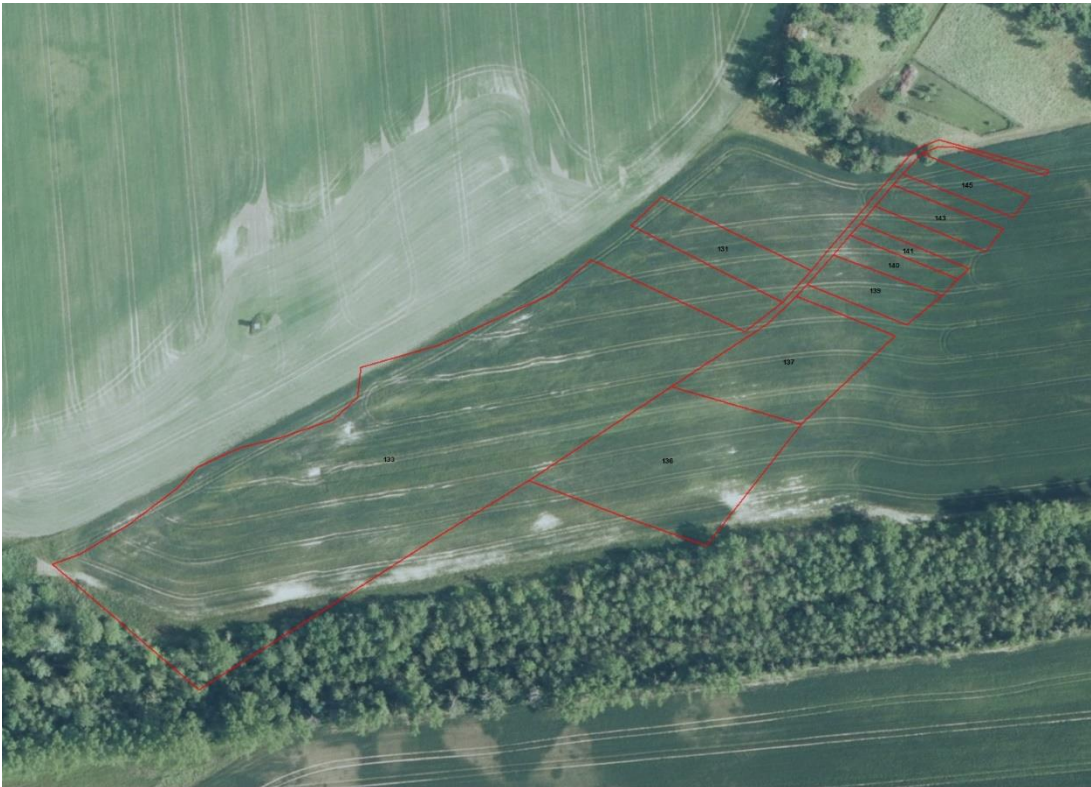
Geobasisdaten: © GeoBasis-DE / BKG (2026). Nutzungsbedingungen: http://sg.geodatenzentrum.de/web_public/nutzungsbedingungen.pdf . © GeoBasis-DE / BKG 2018 (Daten verändert), www.bkg.bund.de ; Lageskizze