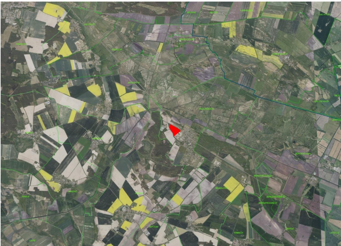
Gemarkungsgrenzen Basis: © Ämter für Geoinformation und Vermessung der Länder Mecklenburg-Vorpommern, Niedersachsen, Brandenburg, Berlin, Sachsen-Anhalt, Sachsen, Thüringen; Geobasisdaten: © GeoBasis-DE / BKG (2024). Nutzungsbedingungen: http://sg.geodatenzentrum.de/web_public/nutzungsbedingungen.pdf ; © GeoBasis-DE / BKG 2018 (Daten verändert); www.bkg.bund.de , Lageskizze