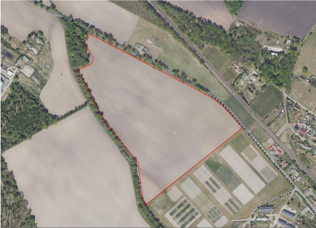
Gemarkungsgrenzen Basis: © Ämter für Geoinformation und Vermessung der Länder Mecklenburg-Vorpommern, Niedersachsen, Brandenburg, Berlin, Sachsen-Anhalt, Sachsen, Thüringen; Geobasisdaten: © GeoBasis-DE / BKG (2024). Nutzungsbedingungen: http://sg.geodatenzentrum.de/web_public/nutzungsbedingungen.pdf ; © GeoBasis-DE / BKG 2018 (Daten verändert); www.bkg.bund.de , Lageskizze