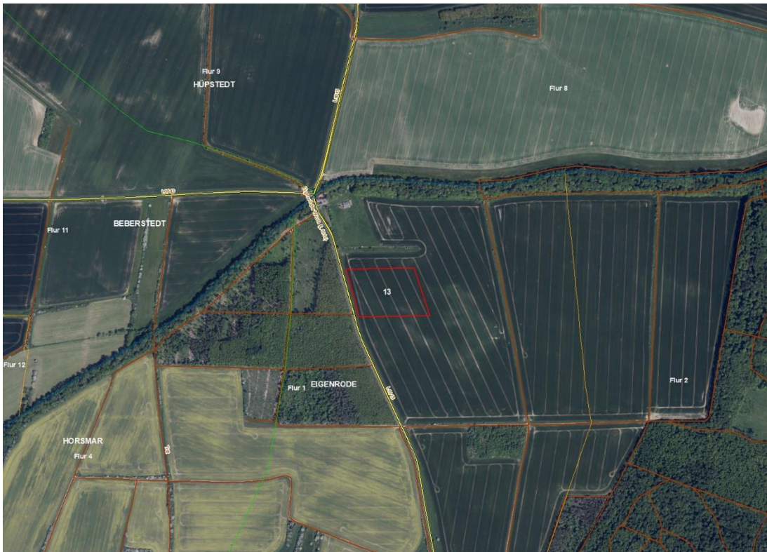
Gemarkung Eigenrode, Flur 1 und 5, FS 13 und 11

Gemarkungsgrenzen Basis: © Ämter für Geoinformation und Vermessung der Länder Mecklenburg-Vorpommern, Niedersachsen, Brandenburg, Berlin, Sachsen-Anhalt, Sachsen, Thüringen, Geobasisdaten © GeoBasis-DE / BKG (2026), Nutzungsbedingungen: http://sg.geodatenzentrum.de/web_public/nutzungsbedingungen.pdf , © GeoBasis-DE / BKG 2018 (Daten verändert), www.bkg.bund.de , Lage-skizze