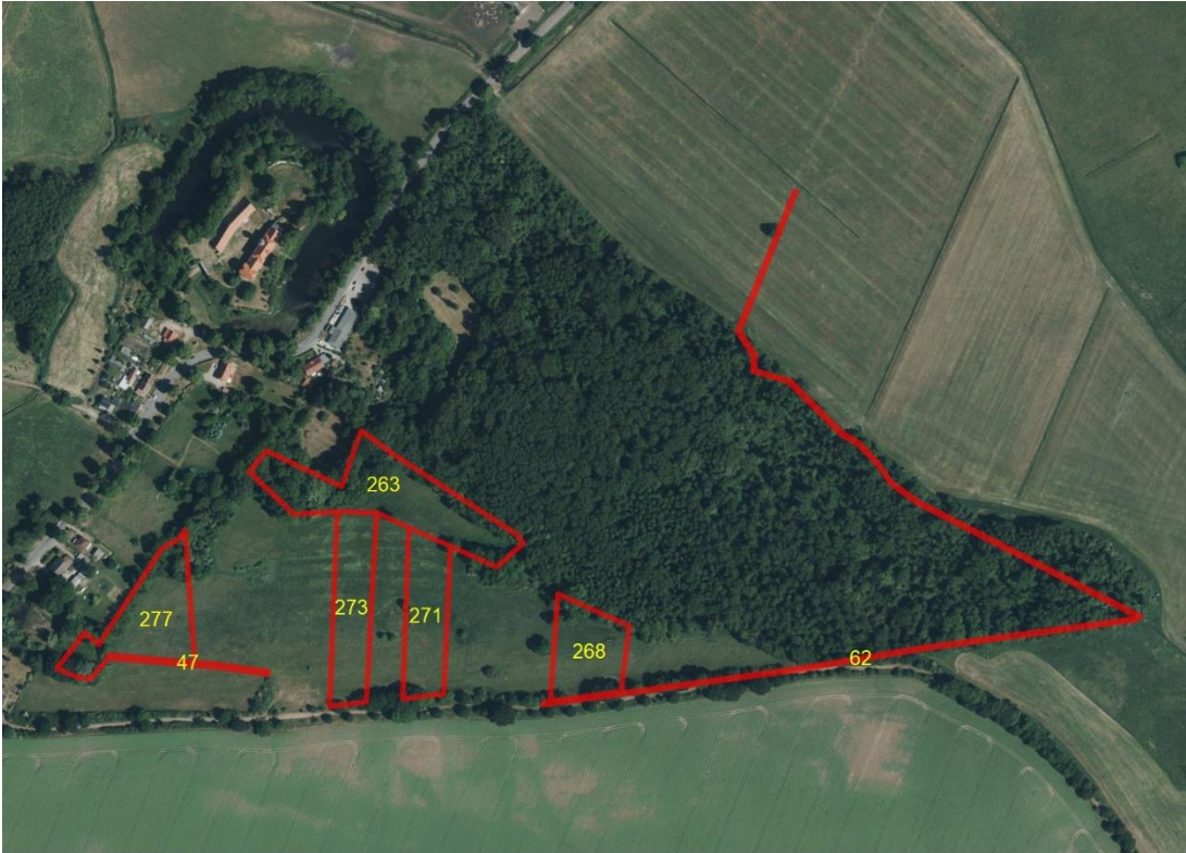
Geobasisdaten: © GeoBasis-DE / BKG (2026). Nutzungsbedingungen: http://sg.geodatenzentrum.de/web_public/nutzungsbedingungen.pdf . Lageskizze