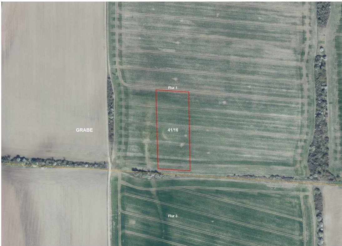
Gemarkung Grabe, Flur 1, 3, 6

Gemarkungsgrenzen Basis: © Ämter für Geoinformation und Vermessung der Länder Mecklenburg-Vorpommern, Niedersachsen, Brandenburg, Berlin, Sachsen-Anhalt, Sachsen, Thüringen; Geobasisdaten: © GeoBasis-DE / BKG (2026), Nutzungsbedingungen: http://sg.geodatenzentrum.de/web_public/nutzungsbedingungen.pdf ; © GeoBasis-DE / BKG 2018 (Daten verändert); www.bkg.bund.de; Lageskizze