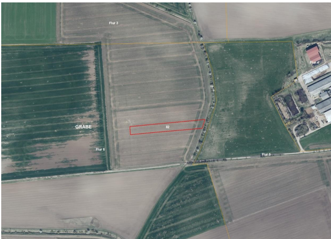
Gemarkung Grabe, Flur 3, FS 26, 116/27, 117/28, 119/25

Gemarkungsgrenzen Basis: © Ämter für Geoinformation und Vermessung der Länder Mecklenburg-Vorpommern, Niedersachsen, Brandenburg, Berlin, Sachsen-Anhalt, Sachsen, Thüringen; Geobasisdaten: © GeoBasis-DE / BKG (2026). Nutzungsbedingungen: http://sg.geodatenzentrum.de/web_public/nutzungsbedingungen.pdf ; © GeoBasis-DE / BKG 2018 (Daten verändert); www.bkg.bund.de ; Lageskizze