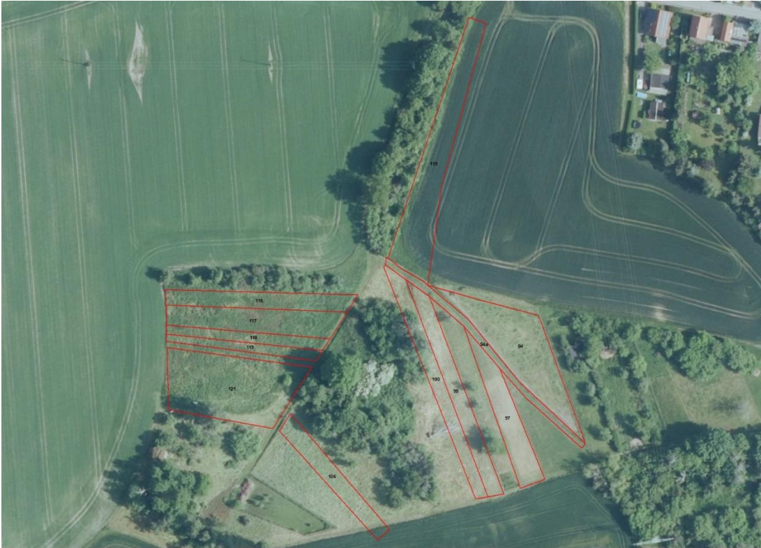
Geobasisdaten: © GeoBasis-DE / BKG (2026). Nutzungsbedingungen: http://sg.geodatenzentrum.de/web_public/nutzungsbedingungen.pdf . © GeoBasis-DE / BKG 2018 (Daten verändert), www.bkg.bund.de ; Lageskizze