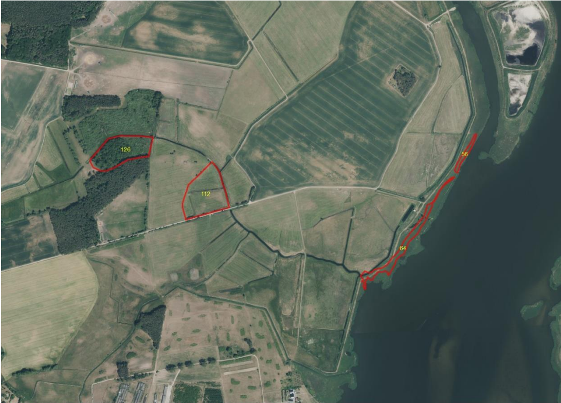
Geobasisdaten: © GeoBasis-DE / BKG (2026). Nutzungsbedingungen: http://sg.geodatenzentrum.de/web_public/nutzungsbedingungen.pdf . Lageskizze