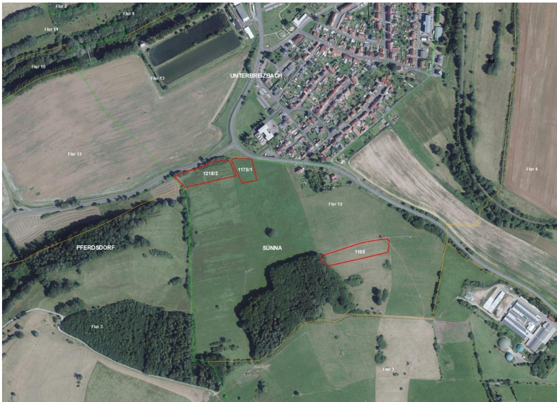
Gemarkungsgrenzen Basis: © Ämter für Geoinformation und Vermessung der Länder Mecklenburg-Vorpommern, Niedersachsen, Brandenburg, Berlin, Sachsen-Anhalt, Sachsen, Thüringen; Geobasisdaten: © GeoBasis-DE / BKG (2025). Nutzungsbedingungen: http://sg.geodatenzentrum.de/web_public/nutzungsbedingungen.pdf , © GeoBasis-DE / BKG 2018 (Daten verändert), www.bkg.bund.de , Lage-skizze