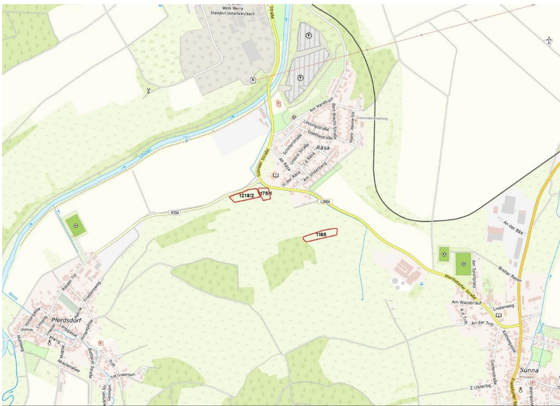
© Bundesamt für Kartographie und Geodäsie, Datenquellen: http://sg.geodatenzentrum.de/web_public/Datenquellen_TopPlus_Open.pdf , © GeoBasis-DE / BKG 2018 (Daten verändert), www.bkg.bund.de , Lage-skizze