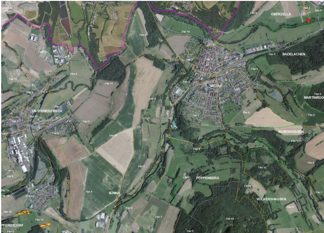
Gemarkungsgrenzen Basis. Lage-skizze