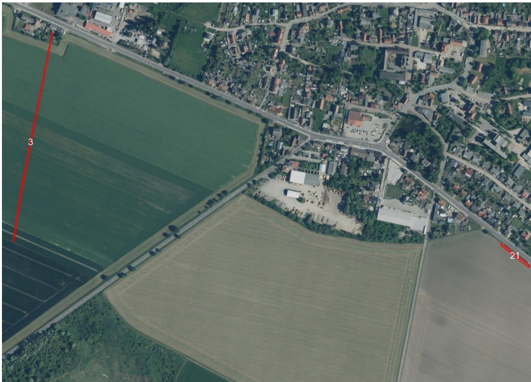
Geobasisdaten: © GeoBasis-DE / BKG (2026), Nutzungsbedingungen: http://sg.geodatenzentrum.de/web_public/nutzungsbedingungen.pdf , © GeoBasis-DE / BKG 2018 (Daten verändert), www.bkg.bund.de , Lageskizze