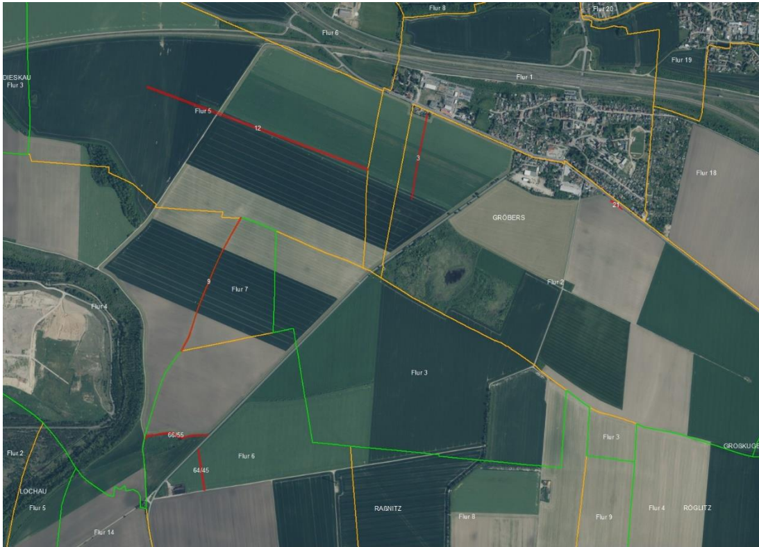
Gemarkungsgrenzen Basis: © Ämter für Geoinformation und Vermessung der Länder Mecklenburg-Vorpommern, Niedersachsen, Brandenburg, Berlin, Sachsen-Anhalt, Sachsen, Thüringen, Geobasisdaten © GeoBasis-DE / BKG (2026), Nutzungsbedingungen: http://sg.geodatenzentrum.de/web_public/nutzungsbedingungen.pdf , © GeoBasis-DE / BKG 2018 (Daten verändert), www.bkg.bund.de , Lageskizze