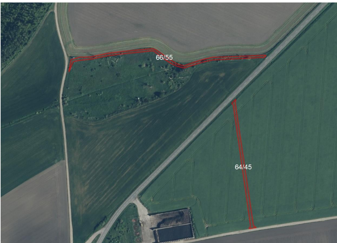
Detailansicht Gröbers Flur 5

Geobasisdaten: © GeoBasis-DE / BKG (2026). Nutzungsbedingungen: http://sg.geodatenzentrum.de/web_public/nutzungsbedingungen.pdf . © GeoBasis-DE / BKG 2018 (Daten verändert). www.bkg.bund.de . Lageskizze