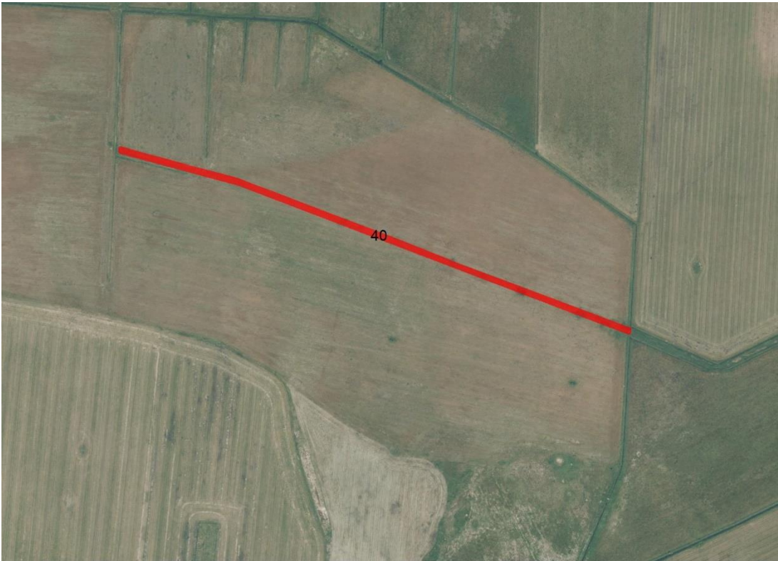
Geobasisdaten: © GeoBasis-DE / BKG (2026). Nutzungsbedingungen: http://sg.geodatenzentrum.de/web_public/nutzungsbedingungen.pdf . Lageskizze