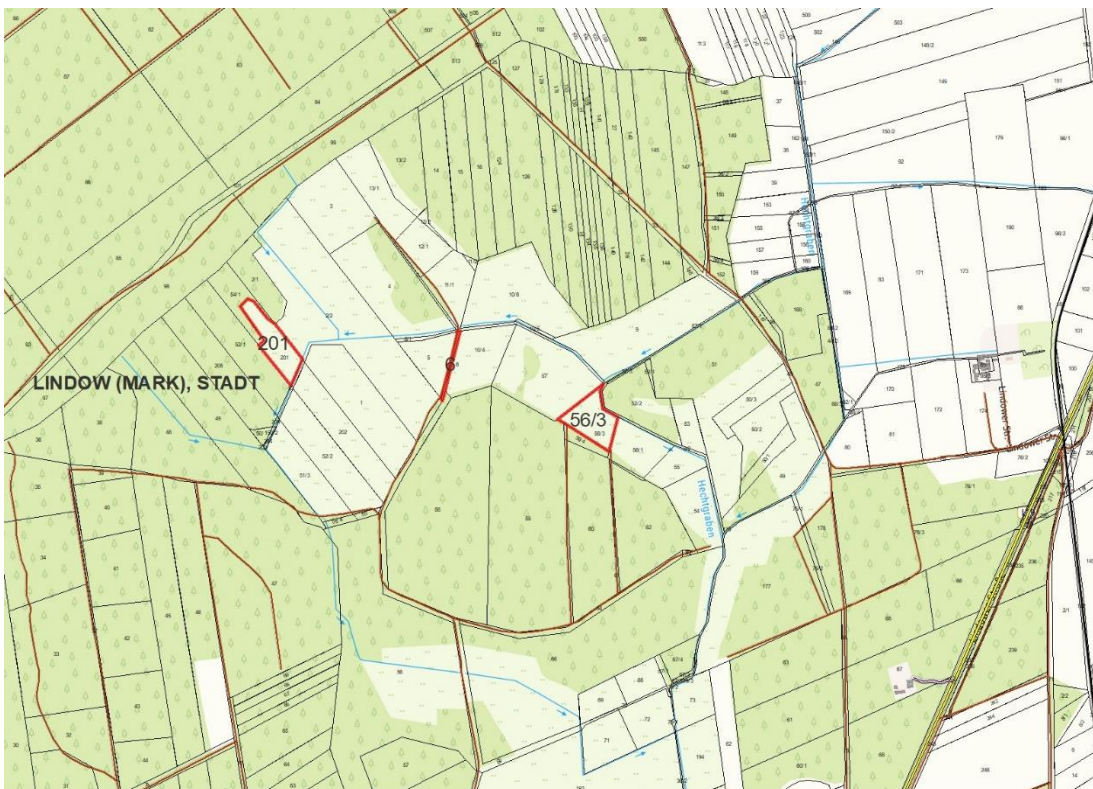
Luftbild - Flurstücke 201, 6 und 56/3

Lageskizze