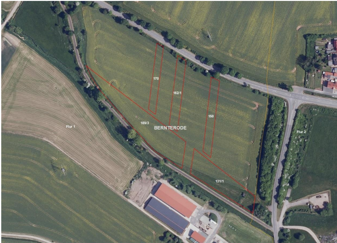
Gemarkungsgrenzen Lage-skizze