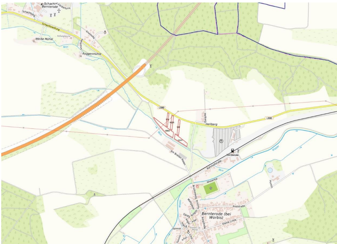
© Bundesamt für Kartographie und Geodäsie (2026), Datenquellen: http://sg.geodatenzentrum.de/web_public/Datenquellen_TopPlus_Open.pdf , © GeoBasis-DE / BKG 2018 (Daten verändert), www.bkg.bund.de , Lage-skizze