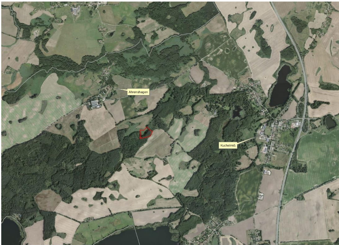
Luftbild BVVG GIS