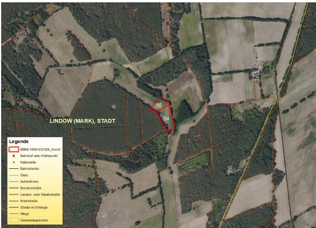
Luftbild der Region

Geobasisdaten © GeoBasis-DE / BKG (2026). Nutzungsbedingungen: http://sg.geodatenzentrum.de/web_public/nutzungsbedingungen.pdf . © GeoBasis-DE / BKG 2024 (Daten verändert). http://sg.geodatenzentrum.de/web_public/nutzungsbedingungen.pdf . © GeoBasis-DE / BKG 2018 (Daten verändert). www.bkg.bund.de. Lageskizze