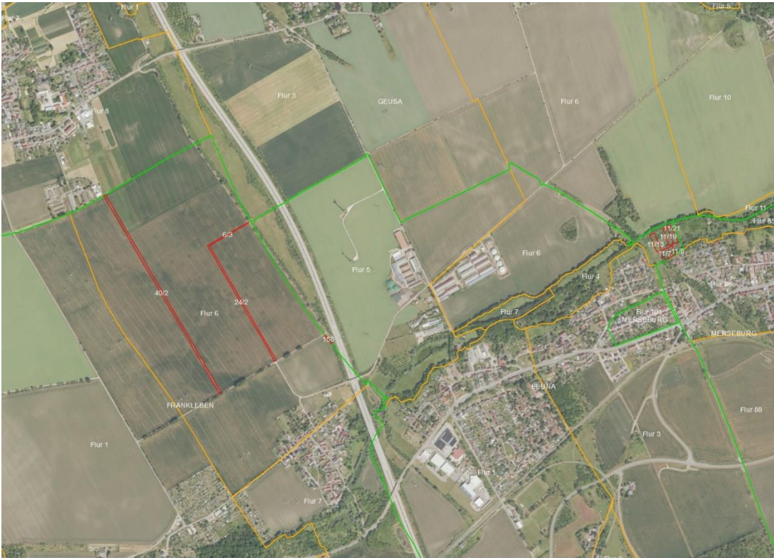
Gemarkungsgrenzen Lageskizze