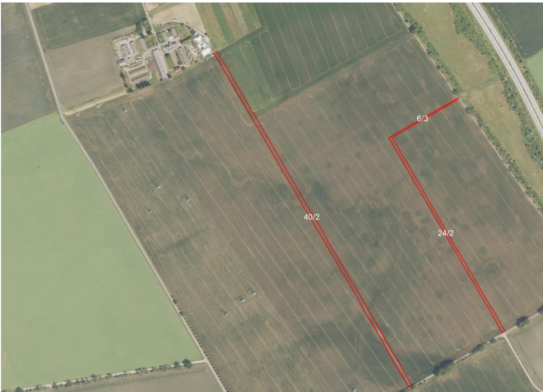
Geobasisdaten: © GeoBasis-DE / BKG (2026). Nutzungsbedingungen: http://sg.geodatenzentrum.de/web_public/nutzungsbedingungen.pdf ; © GeoBasis-DE / BKG 2018 (Daten verändert); www.bkg.bund.de ; Lageskizze