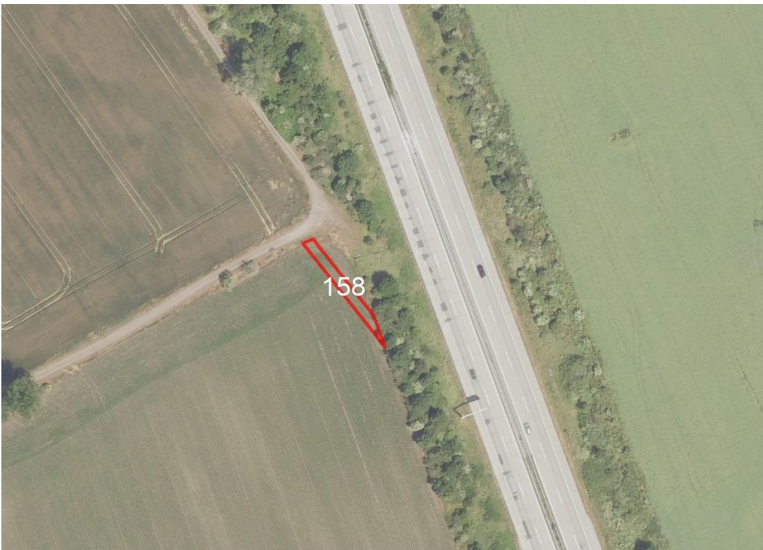
Detailansicht Beuna Flur 4

Lageskizze