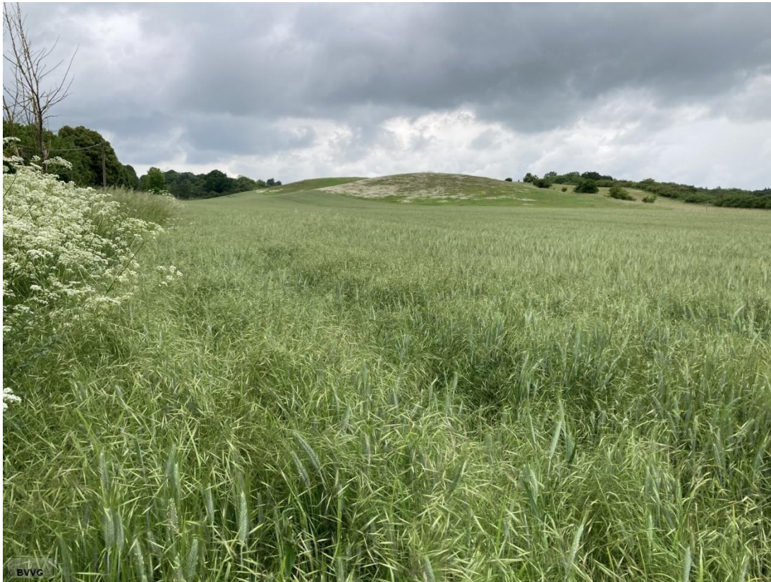
Blick auf die Fläche