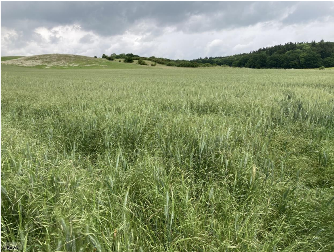
Blick auf die Fläche