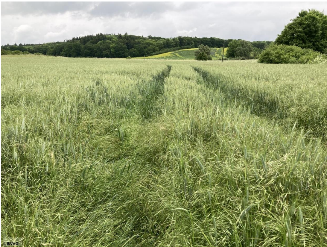
Blick auf die Fläche