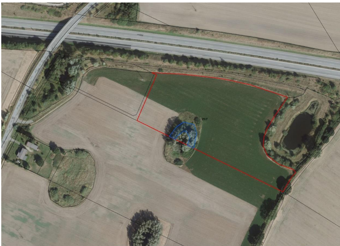
topografische Karte mit Dienstbarkeit (blaue Schraffur)

Geobasisdaten © GeoBasis-DE / BKG (2026). Nutzungsbedingungen: http://sg.geodatenzentrum.de/web_public/nutzungsbedingungen.pdf ; ©GeoBasis-DE/MV/CC BY 4.0 (Quelle verändert); © GeoBasis-DE / BKG 2025 (Daten verändert); © GeoBasis-DE / BKG 2018 (Daten verändert); www.bkg.bund.de ; ©GeoBasis-DE/MV/CC BY 4.0 (Quelle verändert); Lageskizze