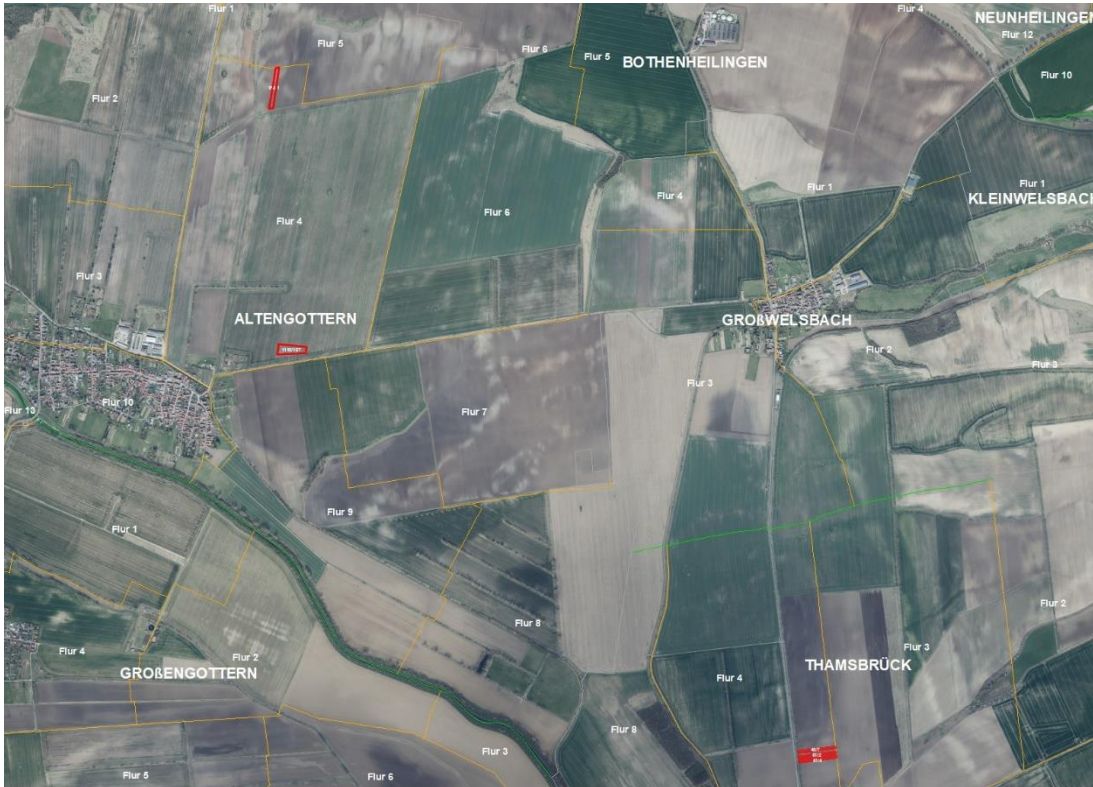
Gemarkungsgrenzen Basis: © Amt für Geoinformation und Vermessung der Länder Mecklenburg-Vorpommern, Niedersachsen, Brandenburg, Berlin, Sachsen-Anhalt, Sachsen, Thüringen, Basis: © Amt für Geoinformation und Vermessung der Länder Mecklenburg-Vorpommern, Niedersachsen, Brandenburg, Berlin, Sachsen-Anhalt, Sachsen, Thüringen, Geobasisdaten: © GeoBasis-DE / BKG (2025), Nutzungsbedingungen: http://sg.geodatenzentrum.de/web_public/nutzungsbedingungen.pdf , Lageskizze