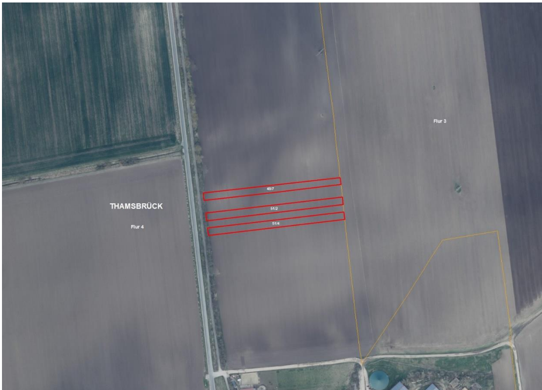
Gemarkungsgrenzen Basis: © Amt für Geoinformation und Vermessung der Länder Mecklenburg-Vorpommern, Niedersachsen, Brandenburg, Berlin, Sachsen-Anhalt, Sachsen, Thüringen, Basis: © Amt für Geoinformation und Vermessung der Länder Mecklenburg-Vorpommern, Niedersachsen, Brandenburg, Berlin, Sachsen-Anhalt, Sachsen, Thüringen, Geobasisdaten: © GeoBasis-DE / BKG (2025), Nutzungsbedingungen: http://sg.geodatenzentrum.de/web_public/nutzungsbedingungen.pdf , Lageskizze