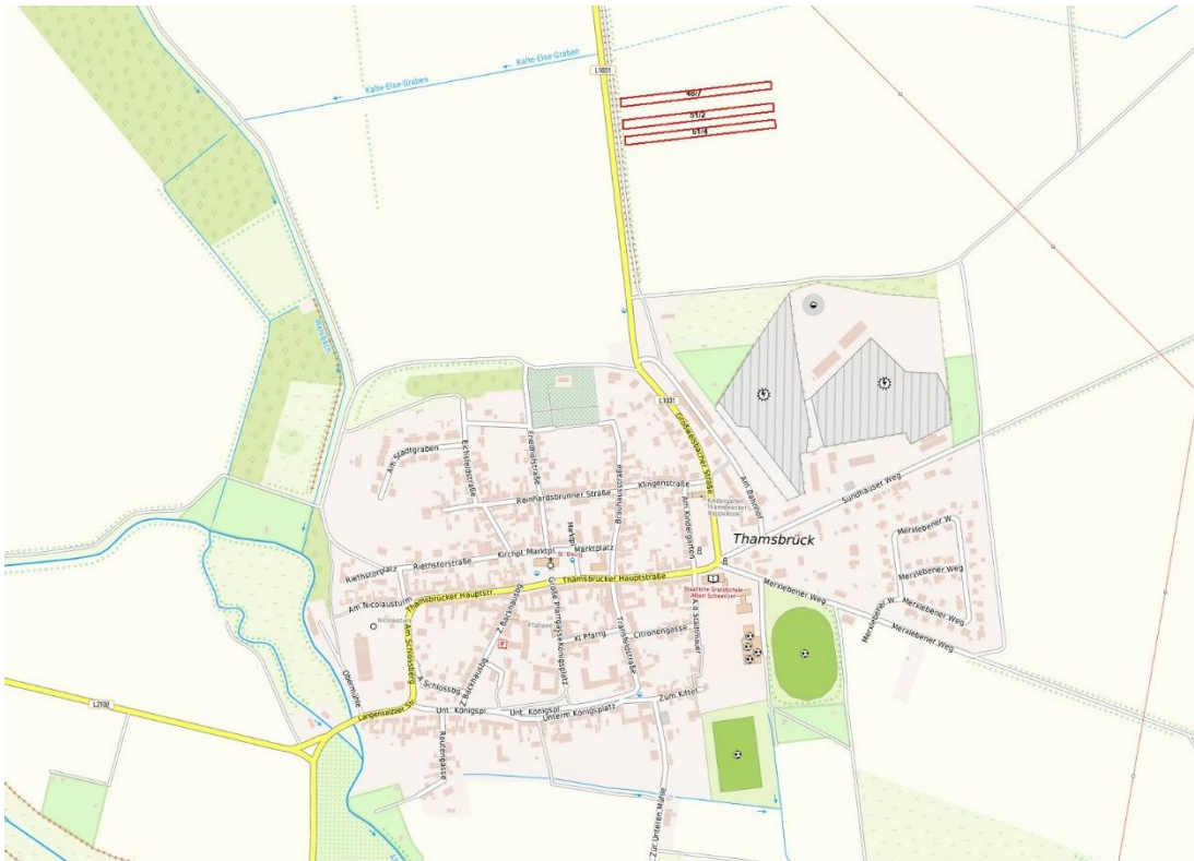
Basis © Ämter für Geoinformation und Vermessung der Länder Mecklenburg-Vorpommern, Niedersachsen, Brandenburg, Berlin, Sachsen-Anhalt, Sachsen, Thüringen; © Bundesamt für Kartographie und Geodäsie (2025). Datenquellen: http://sg.geodatenzentrum.de/web_public/Datenquellen_TopPlus_Open.pdf ; Lageskizze