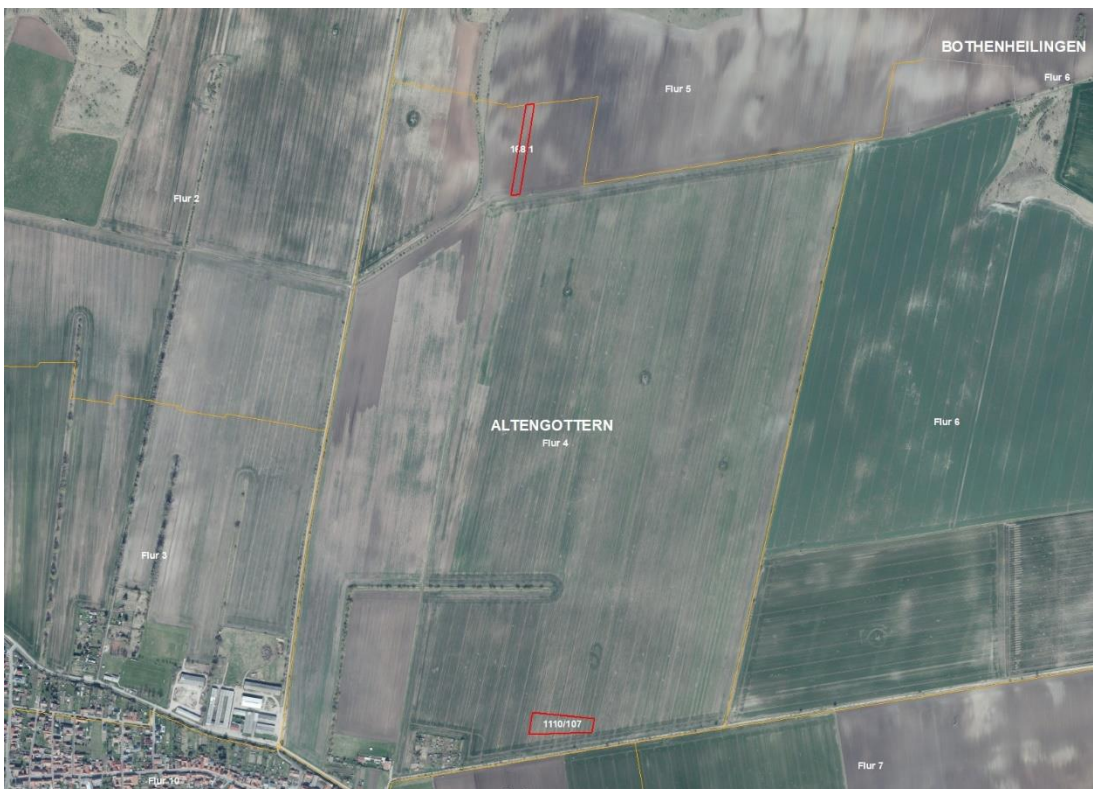
Gemarkungsgrenzen Basis © Ämter für Geoinformation und Vermessung der Länder Mecklenburg-Vorpommern, Niedersachsen, Brandenburg, Berlin, Sachsen-Anhalt, Sachsen, Thüringen; Basis © Ämter für Geoinformation und Vermessung der Länder Mecklenburg-Vorpommern, Niedersachsen, Brandenburg, Berlin, Sachsen-Anhalt, Sachsen, Thüringen; Geobasisdaten © GeoBasis-DE / BKG (2025). Nutzungsbedingungen: http://sg.geodatenzentrum.de/web_public/nutzungsbedingungen.pdf ; Lageskizze