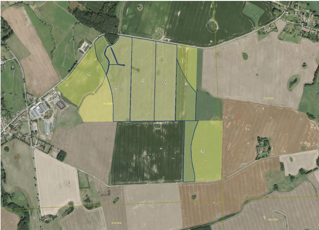
Geobasisdaten: © GeoBasis-DE / BKG (2025), Nutzungsbedingungen: http://sg.geodatenzentrum.de/web_public/nutzungsbedingungen.pdf , © GeoBasis-DE / BKG 2018 (Daten verändert), www.bkg.bund.de , Lageskizze