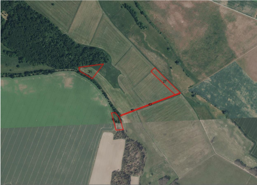
Geobasisdaten: © GeoBasis-DE / BKG (2026). Nutzungsbedingungen: http://sg.geodatenzentrum.de/web_public/nutzungsbedingungen.pdf . © GeoBasis-DE / BKG 2018 (Daten verändert), www.bkg.bund.de ; Lageskizze