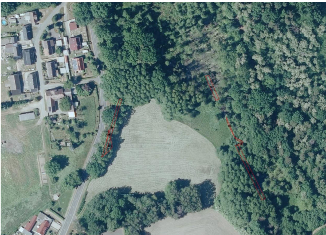
Luftbild Detail 4

Geobasisdaten: © GeoBasis-DE / BKG (2025). Nutzungsbedingungen: http://sg.geodatenzentrum.de/web_public/nutzungsbedingungen.pdf . Lageskizze