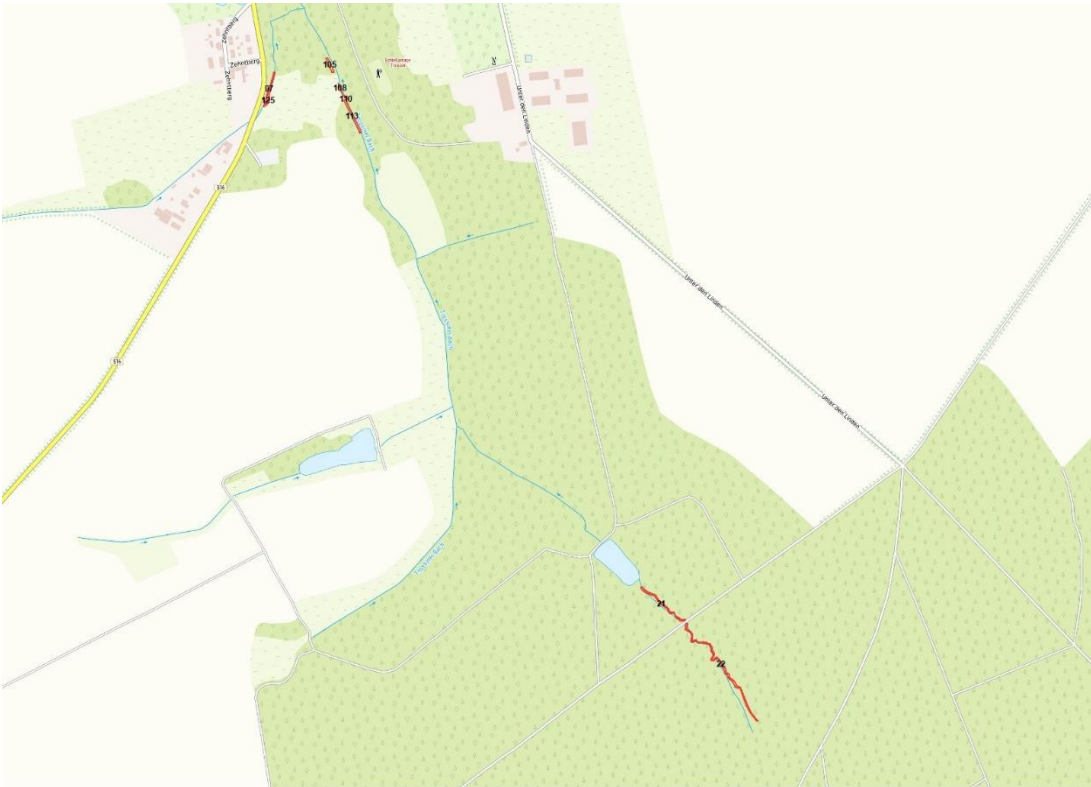
© Bundesamt für Kartographie und Geodäsie (2026). Datenquellen: http://sg.geodatenzentrum.de/web_public/Datenquellen_TopPlus_Open.pdf , Lageskizze