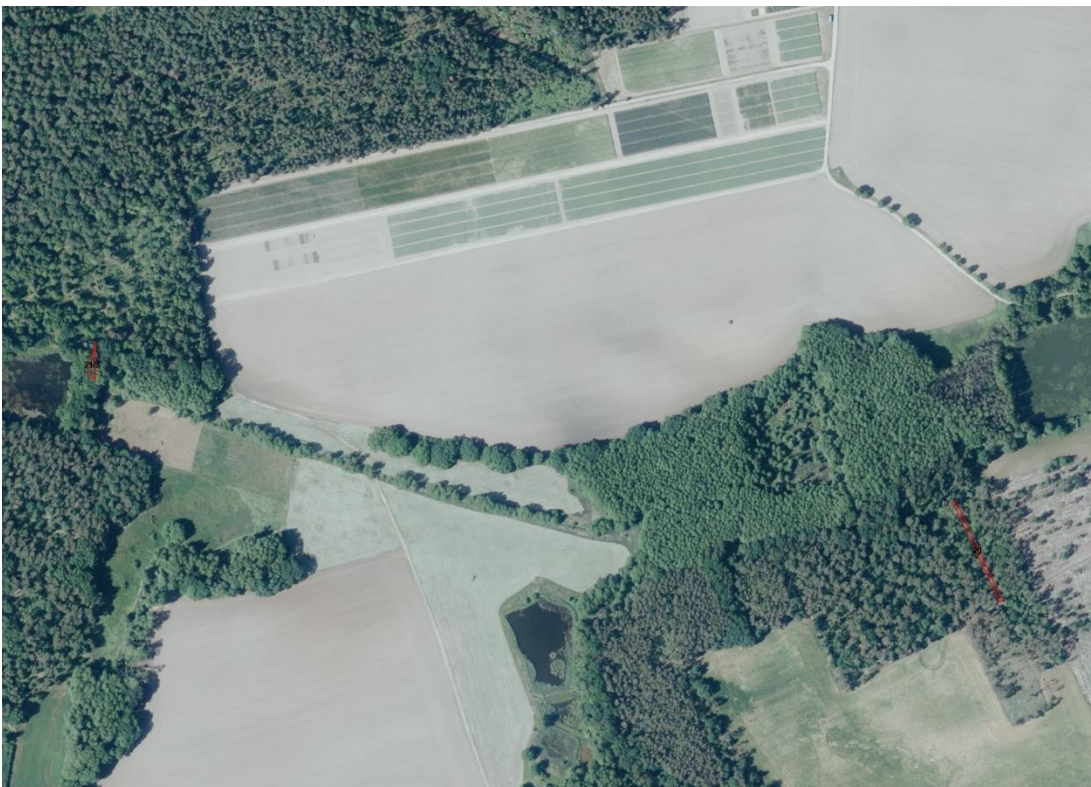
Luftbild Detail 2

Geobasisdaten: © GeoBasis-DE / BKG (2026). Nutzungsbedingungen: http://sg.geodatenzentrum.de/web_public/nutzungsbedingungen.pdf . Lageskizze