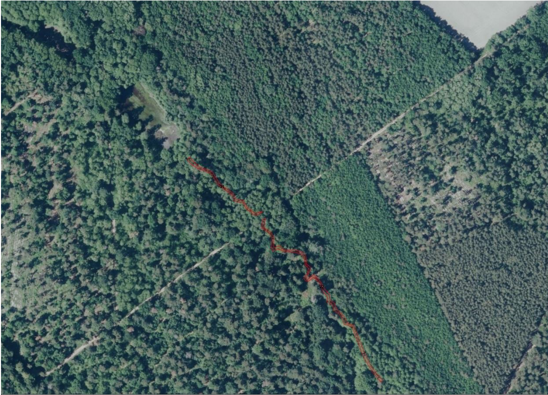
Geobasisdaten: © GeoBasis-DE / BKG (2026). Nutzungsbedingungen: http://sg.geodatenzentrum.de/web_public/nutzungsbedingungen.pdf . Lageskizze