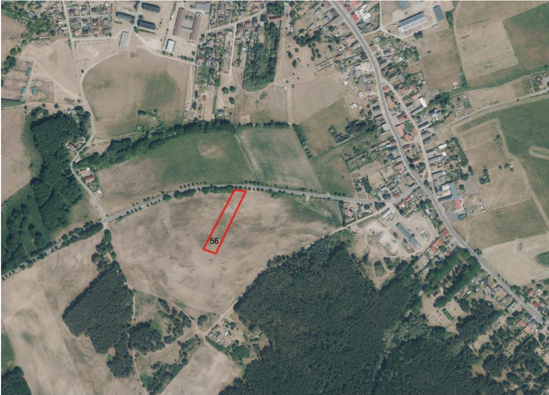
Geobasisdaten: © GeoBasis-DE / BKG (2026). Nutzungsbedingungen: http://sg.geodatenzentrum.de/web_public/nutzungsbedingungen.pdf . © GeoBasis-DE / BKG 2018 (Daten verändert), www.bkg.bund.de ; Lageskizze