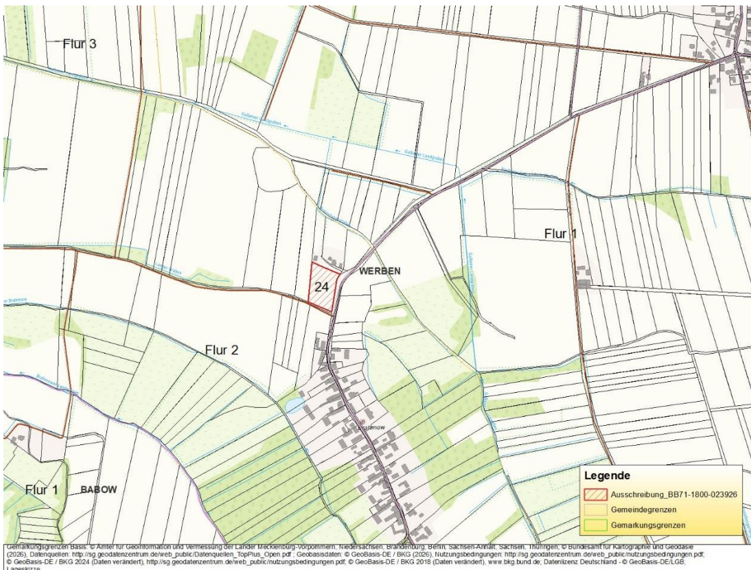
Luftbild mit Flurkarte