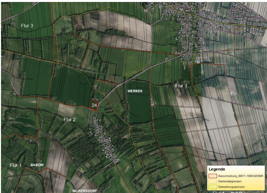
Luftbild vom Ort

Gemarkungsgrenzen Basis: © Ämter für Geoinformation und Vermessung der Länder Mecklenburg-Vorpommern, Niedersachsen, Brandenburg, Berlin, Sachsen-Anhalt, Sachsen, Thüringen, Geobasisdaten © GeoBasis-DE / BKG (2026), Nutzungsbedingungen: http://sg.geodatenzentrum.de/web_public/nutzungsbedingungen.pdf , © GeoBasis-DE / BKG 2024 (Daten verändert), http://sg.geodatenzentrum.de/web_public/nutzungsbedingungen.pdf , © GeoBasis-DE / BKG 2018 (Daten verändert), www.bkg.bund.de, Datenlizenz: Deutschland - © GeoBasis-DE/LGB, Lagestizze