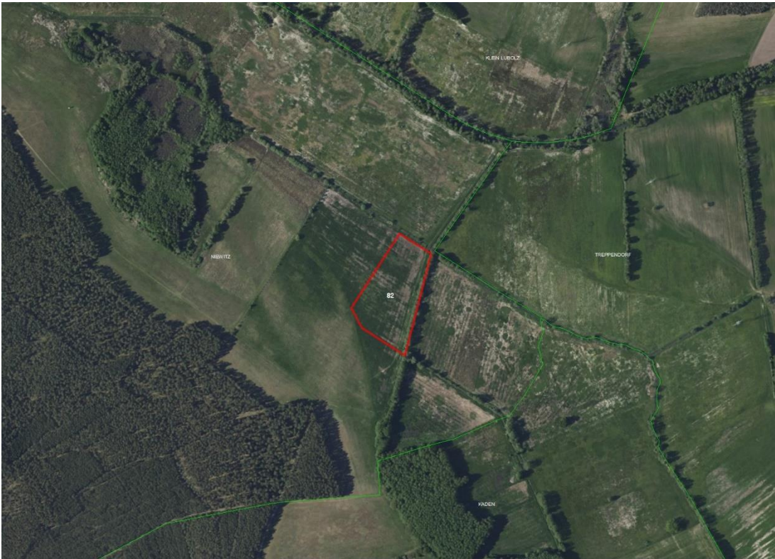
Gemarkungsgrenzen Basis: © Ämter für Geoinformation und Vermessung der Länder Mecklenburg-Vorpommern, Niedersachsen, Brandenburg, Berlin, Sachsen-Anhalt, Sachsen, Thüringen; Geobasisdaten © GeoBasis-DE / BKG (2026). Nutzungsbedingungen: http://sg.geodatenzentrum.de/web_public/nutzungsbedingungen.pdf ; © GeoBasis-DE / BKG 2018 (Daten verändert); www.bkg.bund.de , Lageskizze