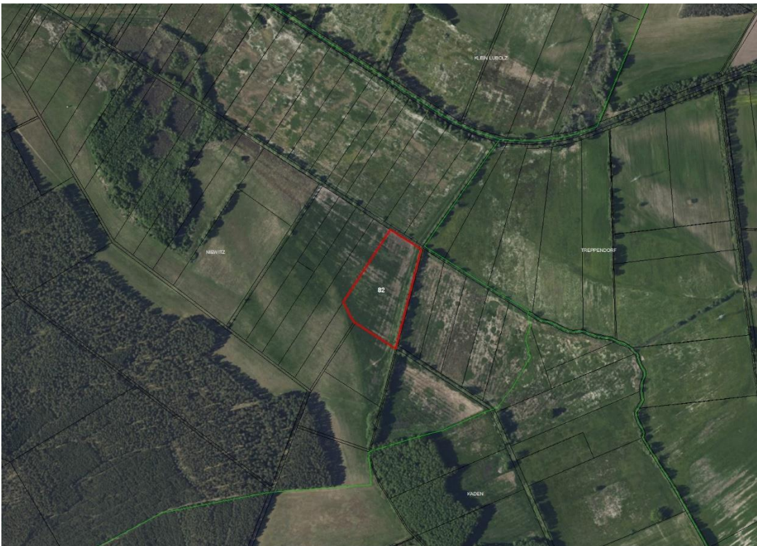
Gemarkungsgrenzen Lageskizze