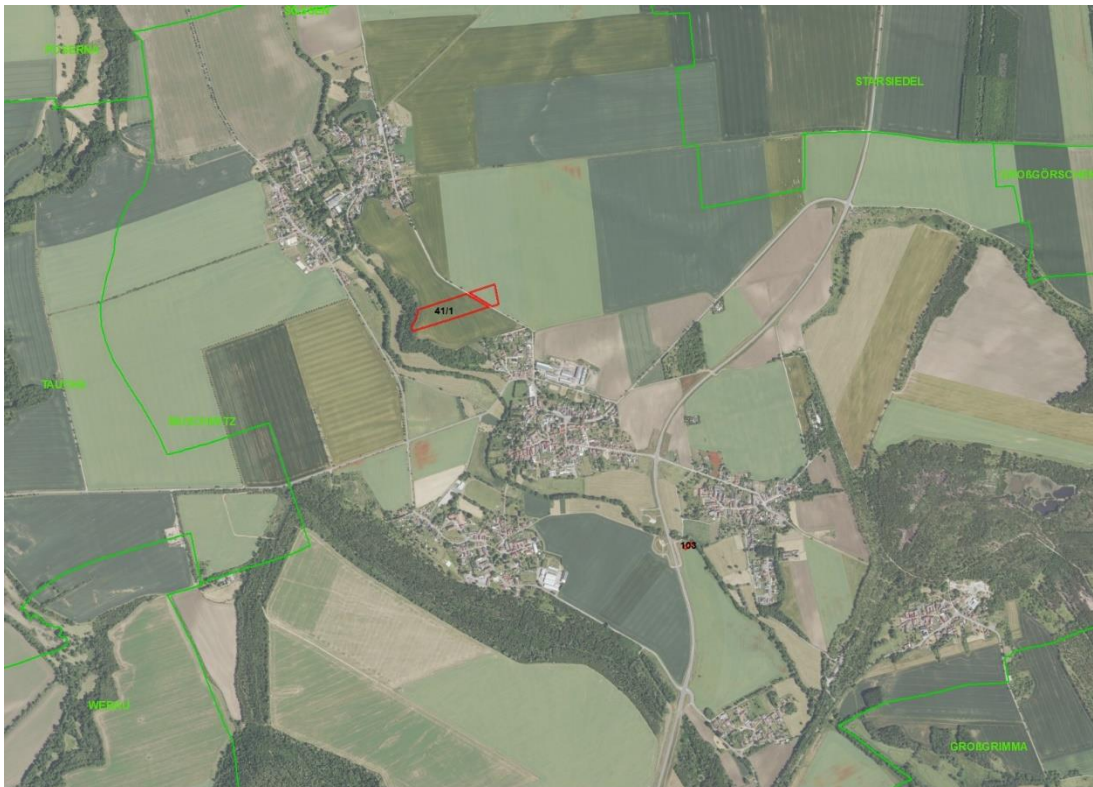
Gemarkungsgrenzen Basis: © Ämter für Geoinformation und Vermessung der Länder Mecklenburg-Vorpommern, Niedersachsen, Brandenburg, Berlin, Sachsen-Anhalt, Sachsen, Thüringen, Basis: © Ämter für Geoinformation und Vermessung der Länder Mecklenburg-Vorpommern, Niedersachsen, Brandenburg, Berlin, Sachsen-Anhalt, Sachsen, Thüringen, Geobasisdaten: © GeoBasis-DE / BKG (2026), Nutzungsbedingungen: http://sg.geodatenzentrum.de/web_public/nutzungsbedingungen.pdf , Lageskizze