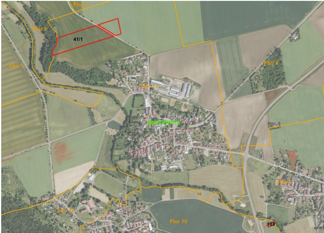
Gemarkungsgrenzen Basis: © Ämter für Geoinformation und Vermessung der Länder Mecklenburg-Vorpommern, Niedersachsen, Brandenburg, Berlin, Sachsen-Anhalt, Sachsen, Thüringen, Basis: © Ämter für Geoinformation und Vermessung der Länder Mecklenburg-Vorpommern, Niedersachsen, Brandenburg, Berlin, Sachsen-Anhalt, Sachsen, Thüringen, Geobasisdaten: © GeoBasis-DE / BKG (2026), Nutzungsbedingungen: http://sg.geodatenzentrum.de/web_public/nutzungsbedingungen.pdf , Lageskizze