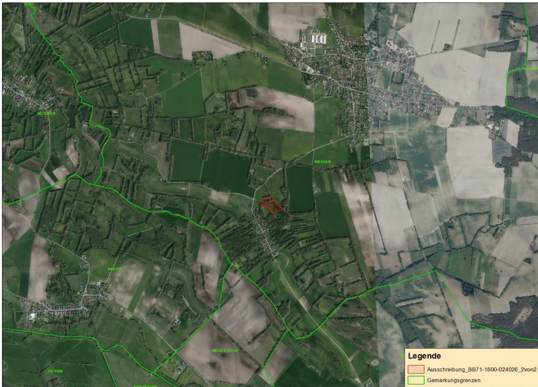
Gemarkungsgrenzen Basis: © Ämter für Geoinformation und Vermessung der Länder Mecklenburg-Vorpommern, Niedersachsen, Brandenburg, Berlin, Sachsen-Anhalt, Sachsen, Thüringen; Geobasisdaten © GeoBasis-DE / BKG (2026). Nutzungsbedingungen: http://sg.geodatenzentrum.de/web_public/nutzungsbedingungen.pdf , © GeoBasis-DE / BKG 2018 (Daten verändert), www.bkg.bund.de, Lageskizze