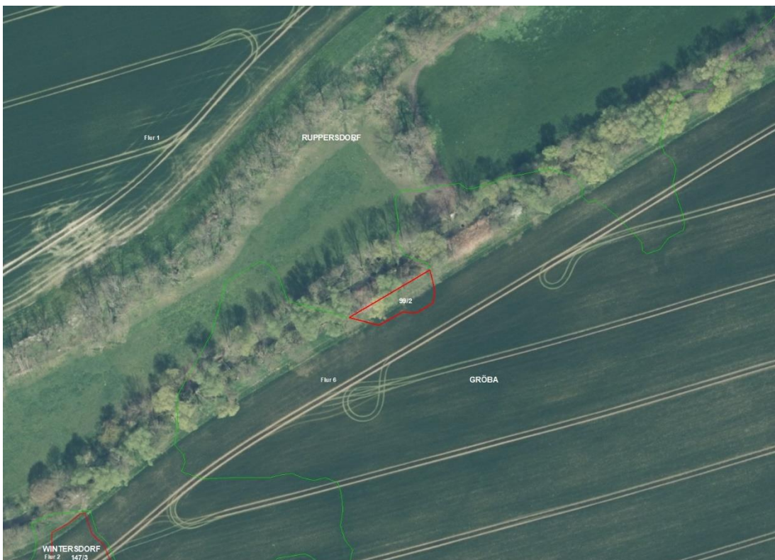
Gemarkung Wintersdorf, Flur 4, FS 30/1, 83/3, 83/4, 94/5, 118/1

Gemarkungsgrenzen Basis: © Ämter für Geoinformation und Vermessung der Länder Mecklenburg-Vorpommern, Niedersachsen, Brandenburg, Berlin, Sachsen-Anhalt, Sachsen, Thüringen; Geobasisdaten: © GeoBasis-DE / BKG (2026). Nutzungsbedingungen: http://sg.geodatenzentrum.de/web_public/nutzungsbedingungen.pdf , © GeoBasis-DE / BKG 2018 (Daten verändert), www.bkg.bund.de , Lageskizze